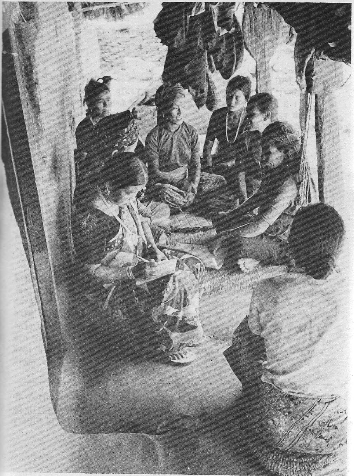
महिला पौर शिक्षण कार्यलय