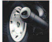
POWERFUL 125cc ENGINE