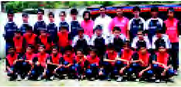
शिविर : नगरपालिका