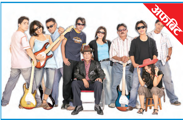
रिक्विक्सका लागि जमघट ।