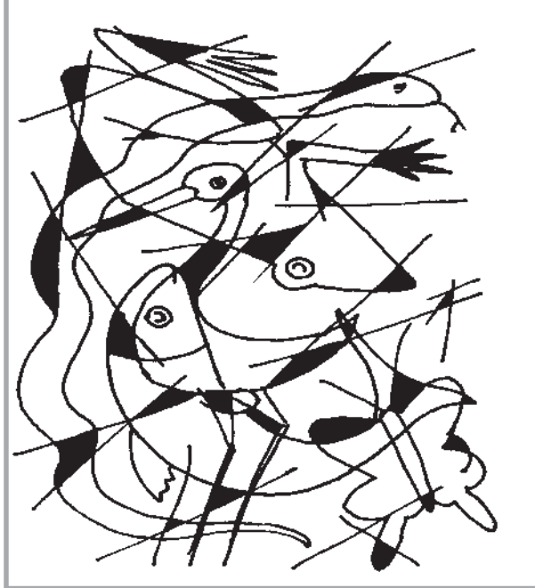
। आँखा, भ्रू, नास, दात, कण्ठ, फेफडा, कान, मुख

तल दिइएको चित्रमा कति समानहरू लुकेका छन् ?