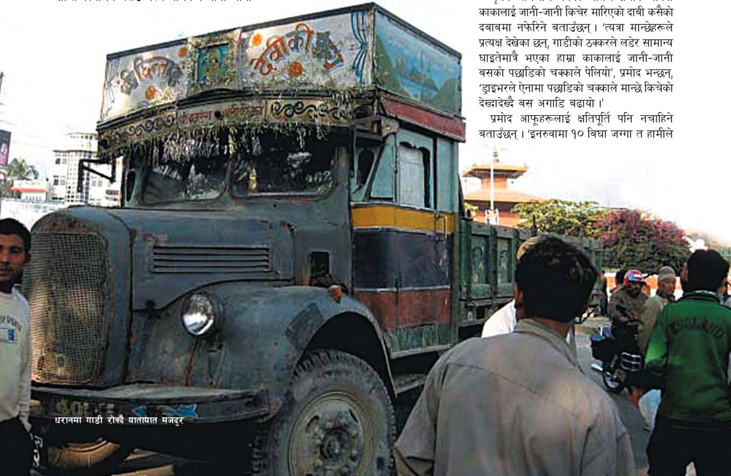
धरानमा गाडी रोक्दै यातायात मजदुर