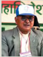
गोपालमान श्रेष्ठ आवास तथा भौतिक योजनामन्त्री

होइन, हामीले टेन्डर आह्वान गर्दा चारवटा कम्पनीले टेन्डर हालेका थिए र तीमध्ये सेभेन ट्रेन्ट वाटर इन्टरनेसनल नामक कम्पनी छानिएको हो । कम्पनीलाई लगाइएको आरोपको बारेमा दूतावासबाट समेत छानबिन गरिएको छ ।