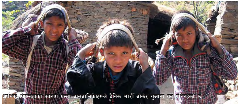
आर्थिक विपन्नताका कारण यस्ता बालबालिकाहरूले दैनिक भारी बोकेर गुजारा गर्न परिरहेको छ