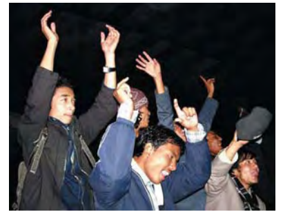
रंग : पूर्वदेखि पश्चिमसम्म संगीत यात्रामा निस्केको नेपथ्यको टोली जहाँ पुग्छ, उत्तिकै माया पाउँछ ५६