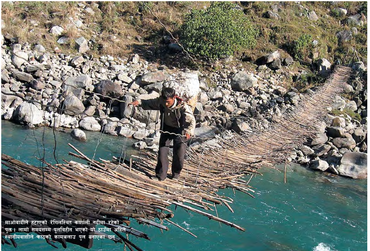
माओवादीले हटाएको रैगलस्थित कर्णाली नदीमा रहेको पुल । लामो समयसम्म पुलविहीन भएको यो ठाउँमा अहिले स्थानीयवासीले काठको कामचलाउ पुल बनाएका छन् ।