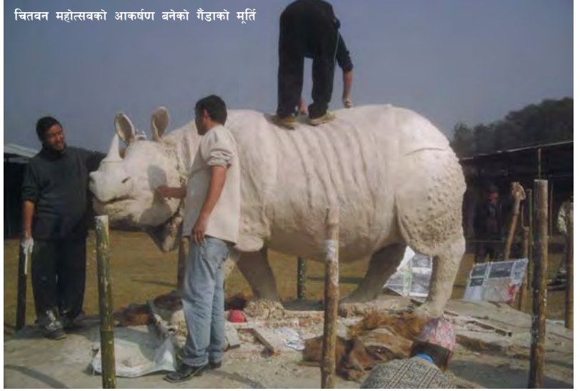
चितवन महोत्सवको आकर्षण बनेको गैंडाको मूर्ति