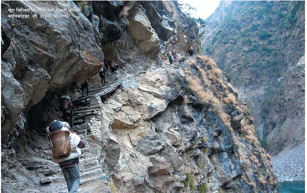
खुट्टा चिप्लियो कि न्यान गया । यस्तो जोखिम कालिकोटका थुप्रै ठाउँमा भाल्नुपर्छ