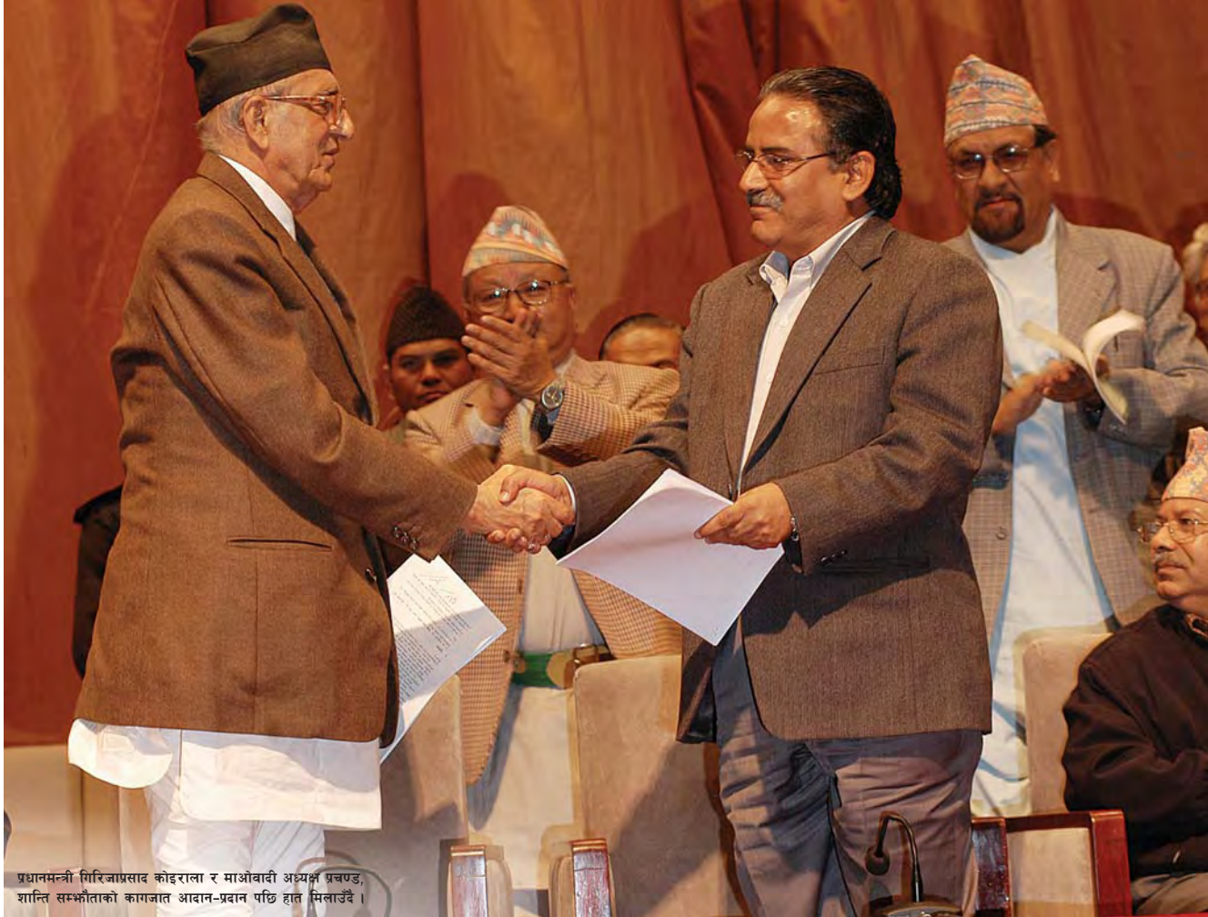
प्रधानमन्त्री गिरिजाप्रसाद कोइराला र माओवादी अध्यक्ष प्रचण्ड, शान्ति सम्झौताको कागजात आदान-प्रदान पछि हात मिलाउँदै ।