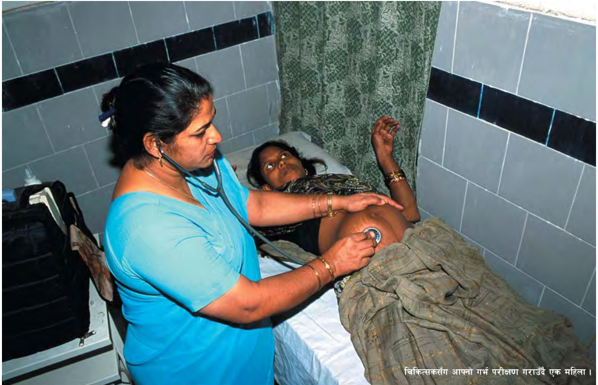
चिकित्सकसँग आफ्नो गर्भ परीक्षण गराउँदै एक महिला ।