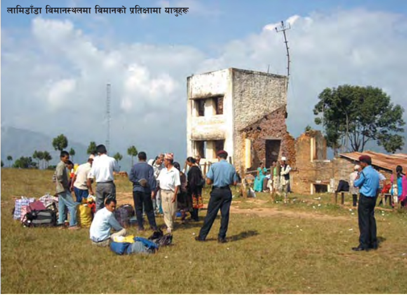
लामिडाँडा विमानस्थलमा विमानको प्रतिक्षामा यात्रुहरू