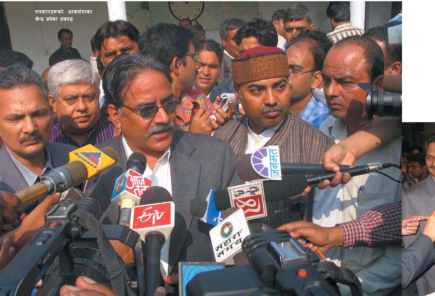
पत्रकारहरूको आकर्षणका केन्द्र बनेका प्रचण्ड

अघिल्लो सप्ताहान्त भएको प्रचण्डको दिल्लीयात्राले माओवादी र उसका गतिविधिहरूलाई भारतीय वैधतामात्र मिलेको छैन, दिल्लीको खास प्रभाव रहने नेपाली राजनीतिमा उनको स्थान पनि अग्लिएको छ। प्रचण्ड एकाएक दक्षिण एसियाली राजनीतिका एक शक्तिकेन्द्रका रूपमा चिनिन थालेका छन्।