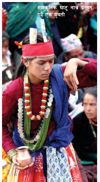
सांस्कृतिक घाटु नाच प्रस्तुत गर्दै एक युवती

लोकगीतको क्षेत्रमा धौलागिरीले विशेष स्थान ओगट्ने गर्छ । सांस्कृतिक लय तथा भाकामा अग्रस्थान ओगट्ने गर्छ बागलुङले । नयाँ पुस्ताका युवायुवतीहरूले आफ्नो कला र संस्कृतिप्रति देखाएको मोह कदर गर्नलायक थियो ।