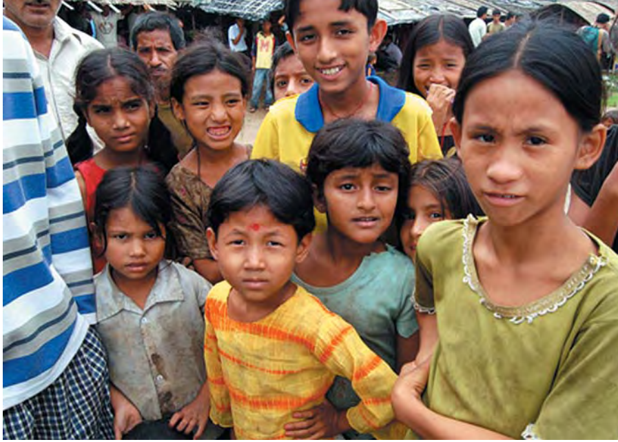
भुटानी शरणार्थी बालबालिकाहरू