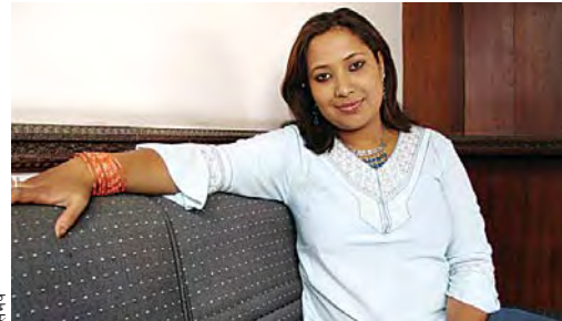
रंग : लुनिभा तुलाधरजस्ता केही कलाकारले नेपाली हास्य विद्यालाई केही उचाइ दिए पनि टेलिभिजनमा हास्य कार्यक्रममा देखिने अधिकांश कलाकार सस्ता जोकरभन्दा तल्लो स्तरका छन् । ५४

अपर्याप्त तयारी : सरकारले भर्खरै मात्र महानगरीय प्रहरीको व्यवस्था गरे पनि परम्परागत तौरतरिकाबाट जनतालाई प्रभावकारी सेवा पुऱ्याउने काम चुनौतीपूर्ण छ । ३६