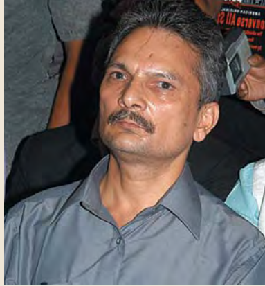
डा. बाबुराम भट्टराई वरिष्ठ नेता माओवादी

हो, त्यही नै निश्चय भएको हो। हतियार र सेनालाई अलग गर्नासाथ त सेना सेना नै रहँदैन नि। हतियार र सेनालाई अलग बनाउने