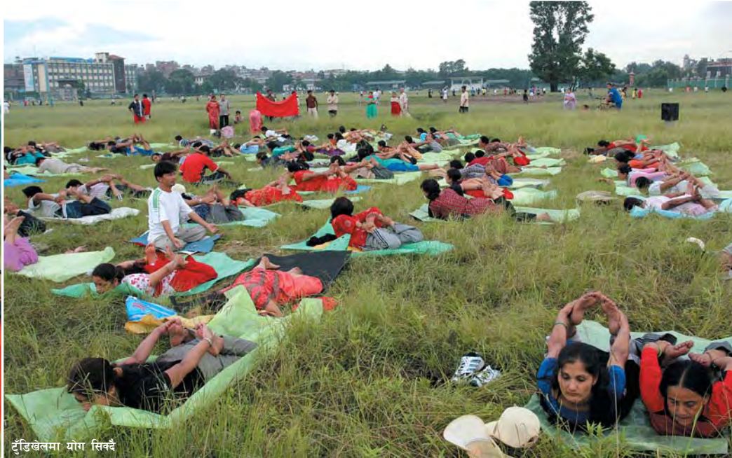
टुँडिखेलमा योग सिक्दै