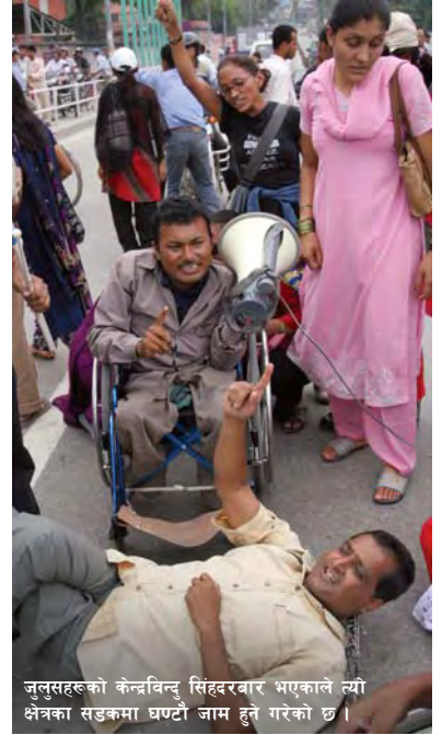
जुलसहरूको केन्द्रविन्दु सिंहदरबार भएकाले त्यो क्षेत्रका सडकमा घण्टौं जाम हुने गरेको छ ।

पराजित मानसिकता बोक्नेको तत्वले स्थिति भाँड्न सानो समूह परिचालन गरेर जनजीवन तहसनहस पार्न खोज्ने प्रचलन नयाँ पक्कै होइन । अहिलेको अवस्था सुधारको लागि संविधानसभाको चाँडो घोषणा भएर नयाँ संविधानमार्फत राज्यको पुनर्संरचना अघि बढ्न सकेमा अस्थिरता अन्त्य हुन्छ ।