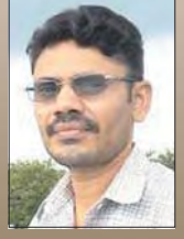
मुमारा म खनाल

सत्ता पक्षले होस् वा विद्रोहीले, राजनीतिक समाधान ननिस्किएर बन्दुक र बन्दुकवाहक शक्तिलाई अन्तर्राष्ट्रिय सुपरीवेक्षणमा राख्नुपर्छ वा दुवै पक्षलाई मान्य हुने कुनै पनि तरिका अपनाउन सकिन्छ। समाधान स्थायी भयो भने दुवैथरि बन्दुक सत्ता पक्षमै विलुप्त हुनेछन्। भएन भने दुवै पक्ष आ-आफ्नो बाटो लाग्छन्। संसारभरि भएको बन्दुक व्यवस्थापनको नियम यही हो। द्रष्ट व्यवस्थापन गर्ने हौं भन्नेहरूले यो कुरा बुझेका छैनन् भनेर भन्न मिल्दैन।