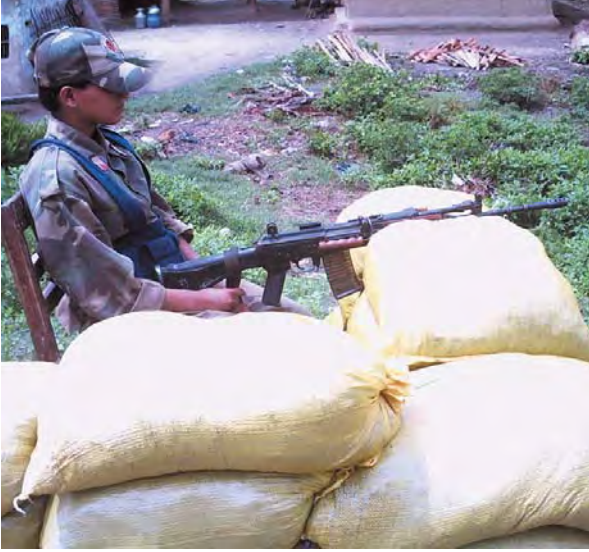
▲ लक्ष्मीनियाँको पोस्टमा सेन्ट्री बसेकी छापामार