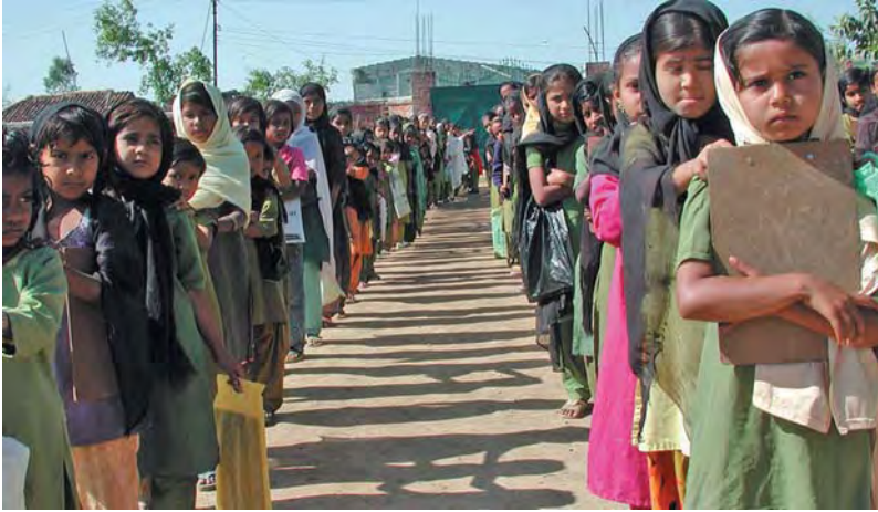
▲ नेपालगञ्जको मदरसाका विद्यार्थीहरू