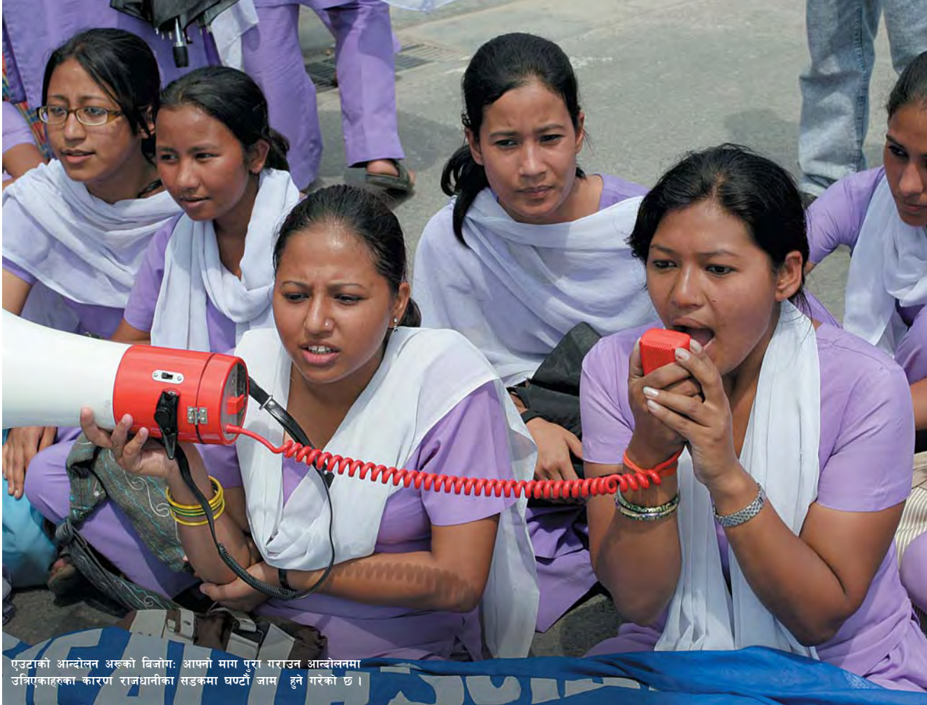
एउटाको आन्दोलन अरुको बिजोग: आफ्नो माग पूरा गराउन आन्दोलनमा उत्रिएकाहरूका कारण राजधानीका सडकमा घण्टौं जाम हुने गरेको छ ।