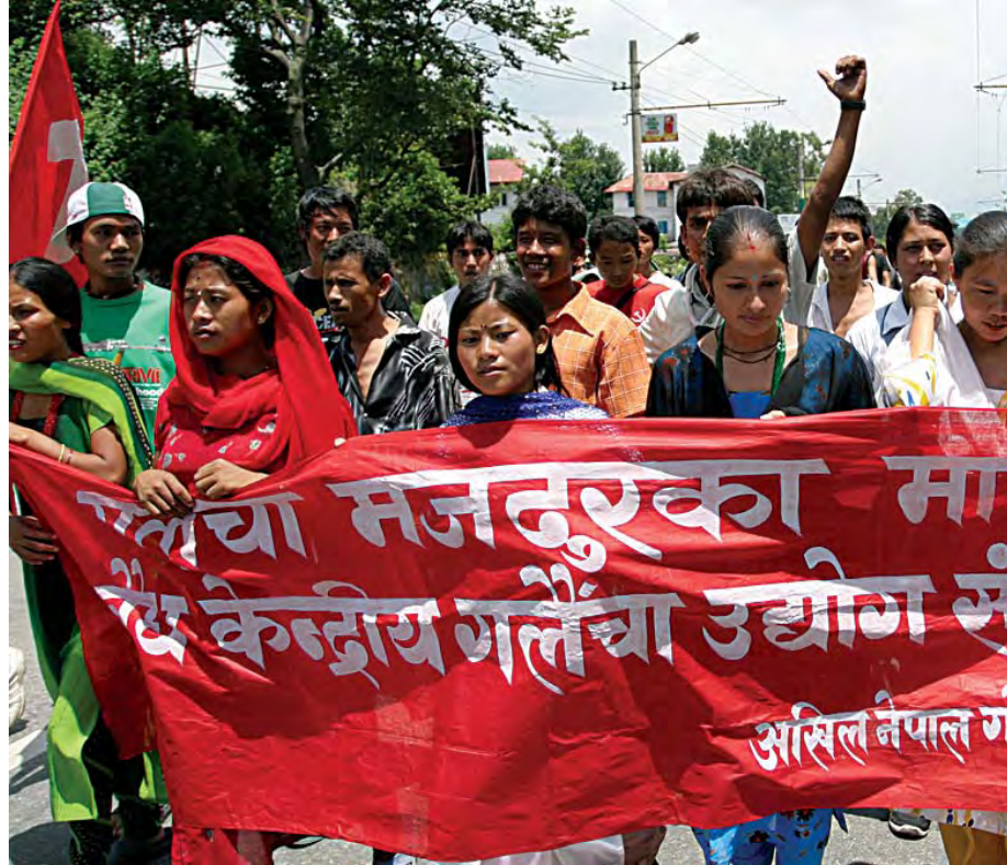
▲ अनेकन नाम र मागमा निकालेका यस्ता जुलुसका कारण राजधानीको जीवन अस्तव्यस्त भएको छ।