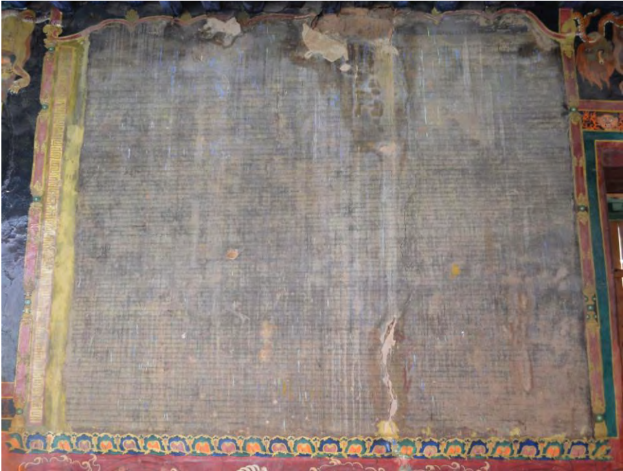
Wall inscription of the Nechung Record , Nechung Monastery Courtyard.