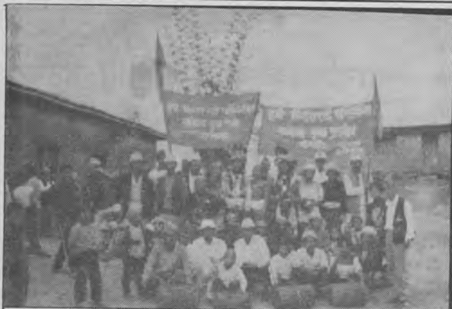
२०५६ सालमा बाक्सलामा दुकिराफको आयोजनामा सम्पन्न साकेला नाच प्रदर्शनको एकफलक