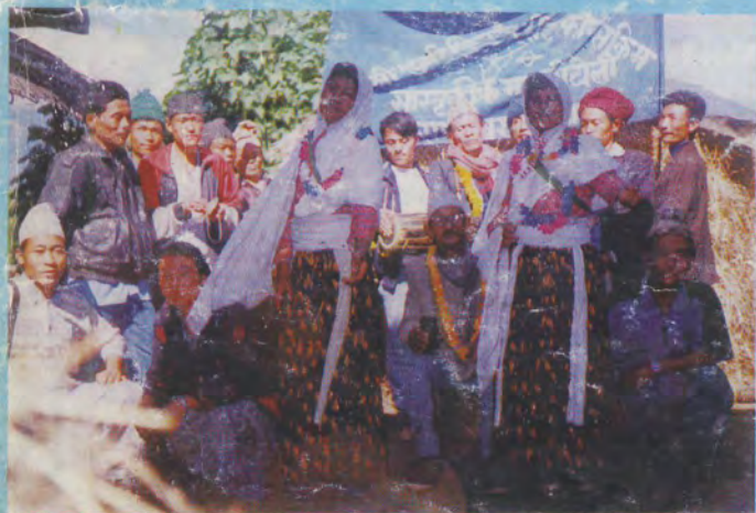
पूर्वेली दुमी किरात राईहरूको मारुनी नाचको एक झलक