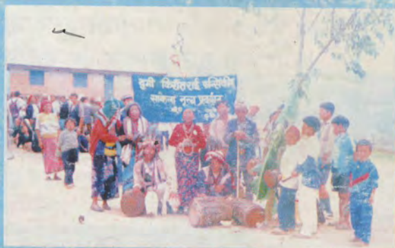
दुमी किरातराईहरूको साकेला प्रदर्शन