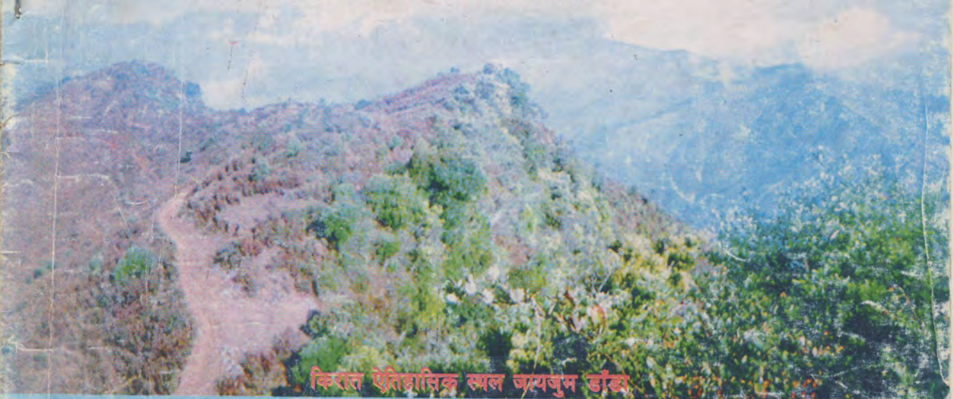
किरात ऐतिहासिक स्थल जयजुम डाँडा