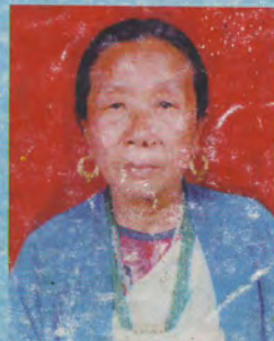
किरात धर्म संस्कृतिका मस्युमे अधिष्ठा राई