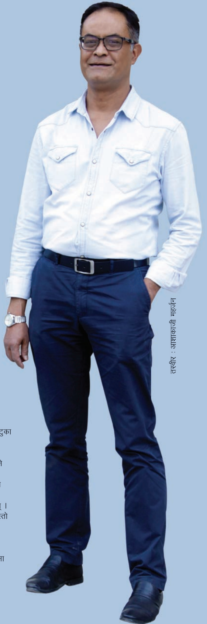
तस्वीर : आशाकाजी महर्जन