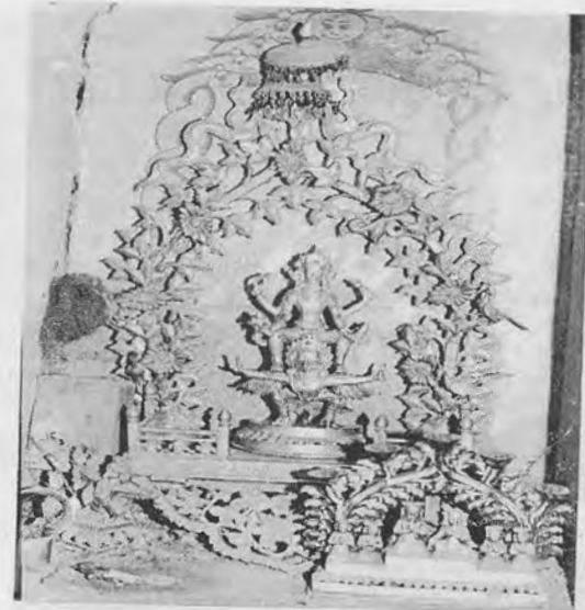
चित्र २ ख: दण्डपाणि परिवारको सालिगसहितको आरति, कदमसहितको श्रीकृष्णको सिंहासनमा अहिले श्रीकृष्ण नहुँदा चतुर्बाहु गरुडनारायण विराजमान छन्, सिंहासनको पार्श्वभागको भित्तामा चित्रित नवनाग