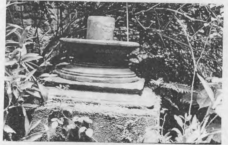
चित्र नं. ६ हाल पुरिएर विलुप्त भइसकेको 'मार्कण्डेय तलाउ' को एक चिनो-अंश-शिवलिङ्ग, तेह्रौं शताब्दी