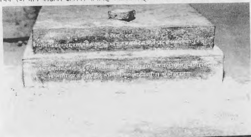
चित्र २१: भाले ब्य सिंहको आसनको वि.सं. १९६७ को अभिलेख