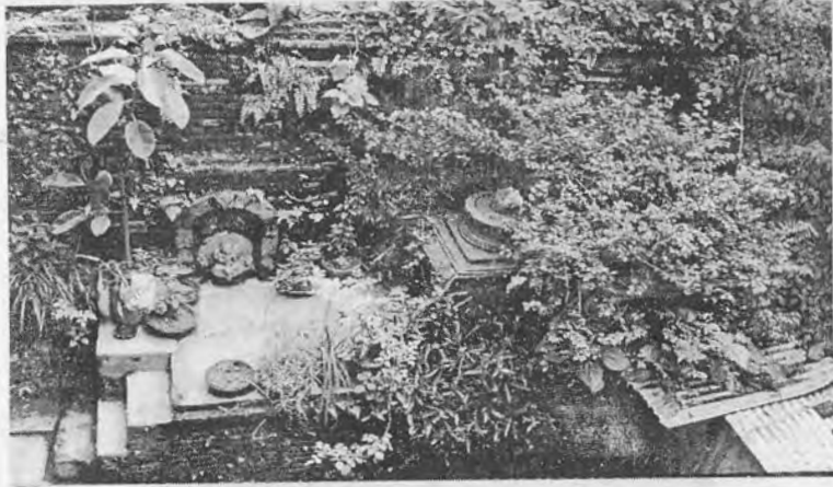
चित्र नं. ४ चोकभित्रका गरुडनारायण र शिवलिङ्ग