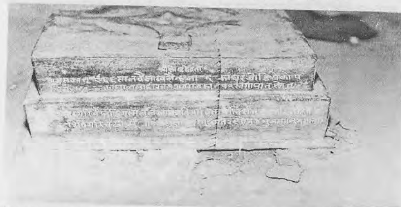
चित्र १९: आगं कोठाको ढोकाको बायाँपट्टि स्थापित सिहिनीको आसनमा कुँदिएको वि.सं. १९६७ को अभिलेख ।