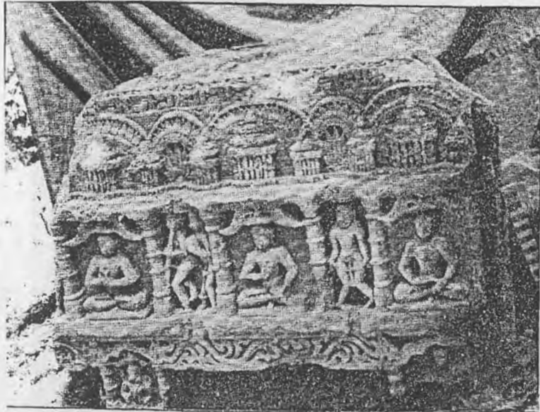
Figure 8: Narrative Scenes in a single stone-slab