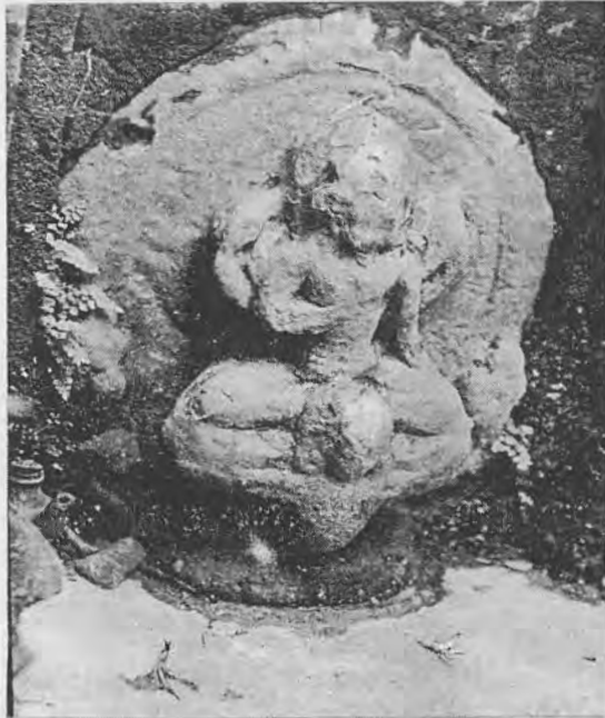
चित्र नं. ५: चारदशक जति अघि भारपात सफा गर्ने क्रममा फेला परेको, उडिरहेका गरुडमाथि पलेटी कसेर बसेका, प्रस्तरको चतुर्बाहु नारायणको मूर्ति, सातौं शताब्दी