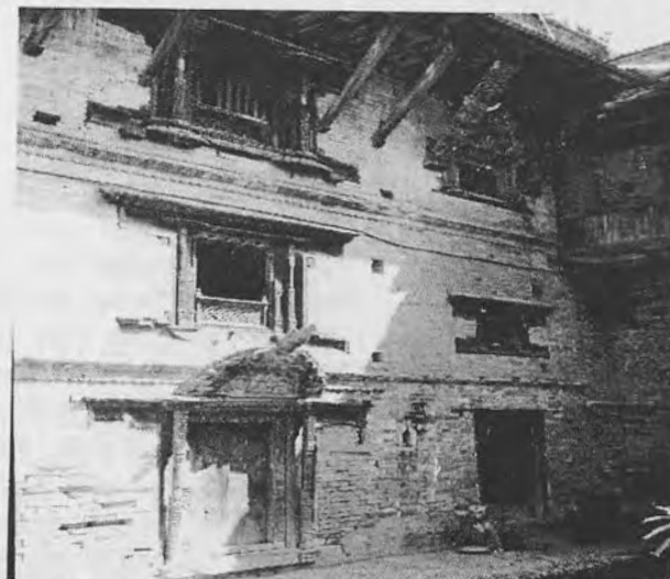
चित्र २३: "के दिन रात कस्को भर छ र ! ... आखिर सुरक्षाका लागि मानिसहरु हाम्रै भरमा ढुक्क हुँदा रहेछन् !" वैद्य आगँघरको सुरक्षा प्रदान गरिरहेका दुइवटा (कलो, खैरो रङ्गका) कुकुरहरु ।