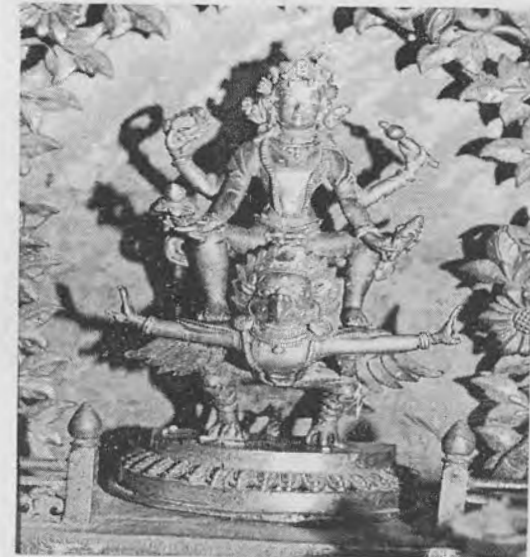
चित्र ३: चतुर्बाहु गरुडनारायण