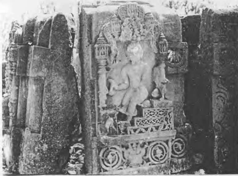
Figure 7: The Buddha holding honey offered by the monkeys