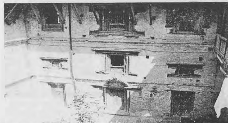
चित्र ११: भिसिचो तँचाको पश्चिमतर्फ अवस्थित वैद्यहरुको आरामघर