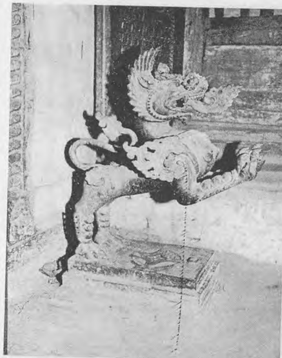
चित्र १८: आगं कोठाको ढोकाको बायाँपट्टि स्थापित उड्न लागेका पोथी 'व्व सह'