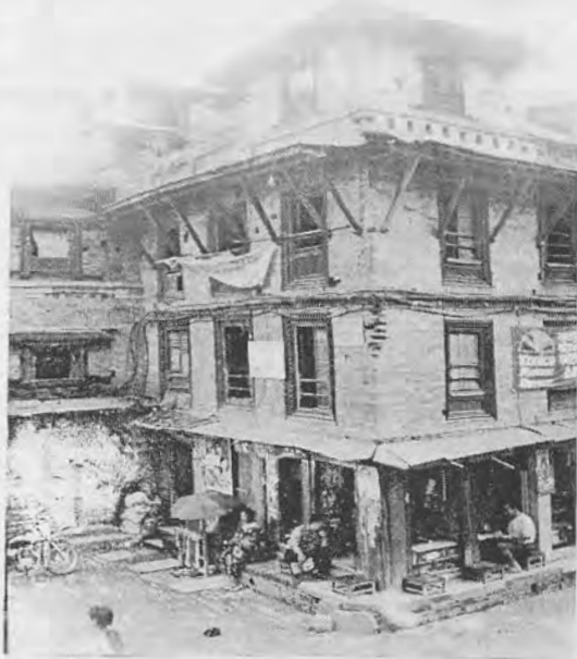
चित्र १ : राणा प्रधानमन्त्री जङ्गबहादुरको पालामा बनाइएको सुकुलढोकास्थित दण्डपाणिर्को घर