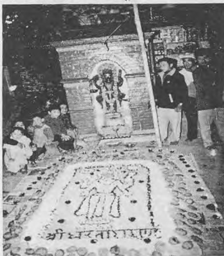
चित्र ९: आखिर, जहाँ गए पनि परम्परा/ संस्कार चाहिँ साथमै छ, भक्तहरुले अर्पित गरेको श्रद्धाभक्ति-सम्मान पनि सामुन्ने नै छ। सकिमना पुन्ही (आश्विन शुक्ल पूर्णिमा) को बेलुका श्रीधर नारायणको मूर्ति सामुन्ने 'नसा ब्येगु' पर्व पूजा-प्रदर्शन