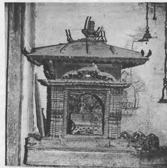
चित्र २२ जीवित-कुमारी विराजमान गराई पूजा गर्न बनाइएको मल्लकालिक कलात्मक काष्ठ मन्दिर