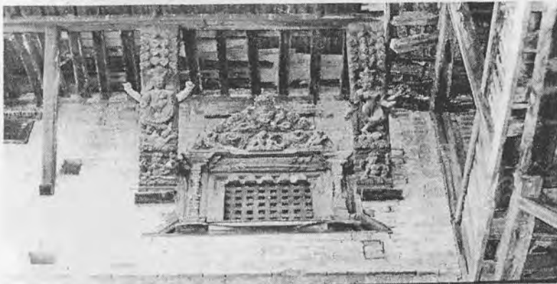
चित्र १३: वैद्य आर्गंघरको, आँगकोठाको यस एकमुखे आँखीभयालको तोरणमा उमामहेश्वर, सो भयालको दायाँपट्टिको टुँडालमा भैरव(वेताल-आसन) र गणेश र त्यसैगरी बायाँपट्टिको टुँडालमा सिंहवाहिनी भवानी र कुमार देखापर्छन् । भैरवका चार हातमध्ये अगाडिका दुई हात र त्यसैगरी भवानीको दायाँपट्टिका दुई हात कालक्रमले गर्दा भरिसकेको अवस्थामा छ ।