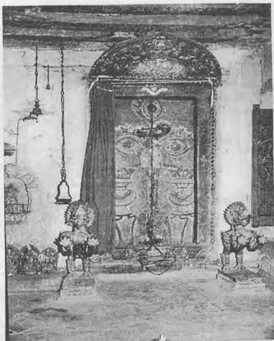
चित्र १६: आगं कोठा जाने ढोका