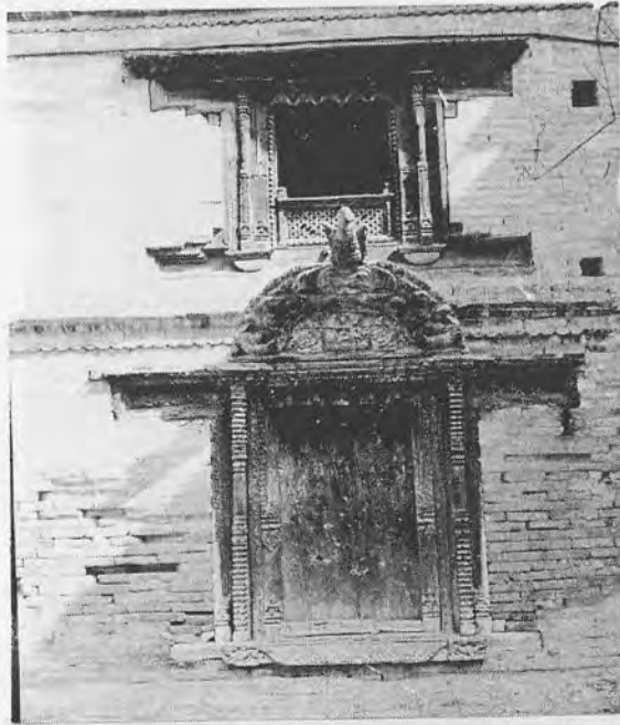
चित्र १२: वैद्य आर्गंघर पस्ने काण्डनिर्मित यो कलात्मक ढोकाको तोरणको बीचमा उमामहेश्वर र दायाँ बायाँ गणेश र कुमार छन् ।