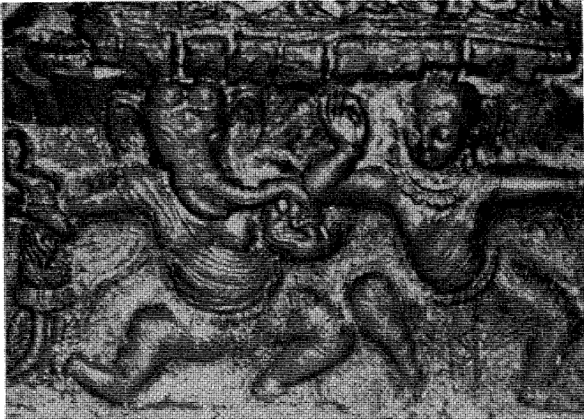
चित्र नं. ३