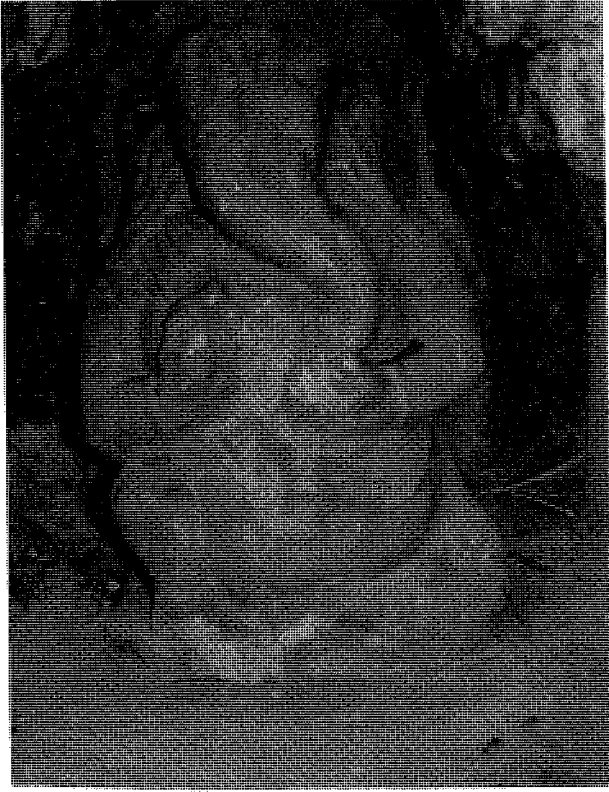
चित्र नं. २