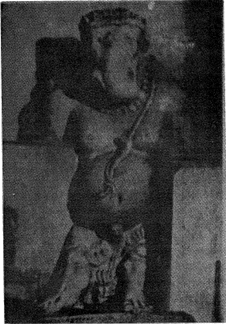
चित्र नं. ९