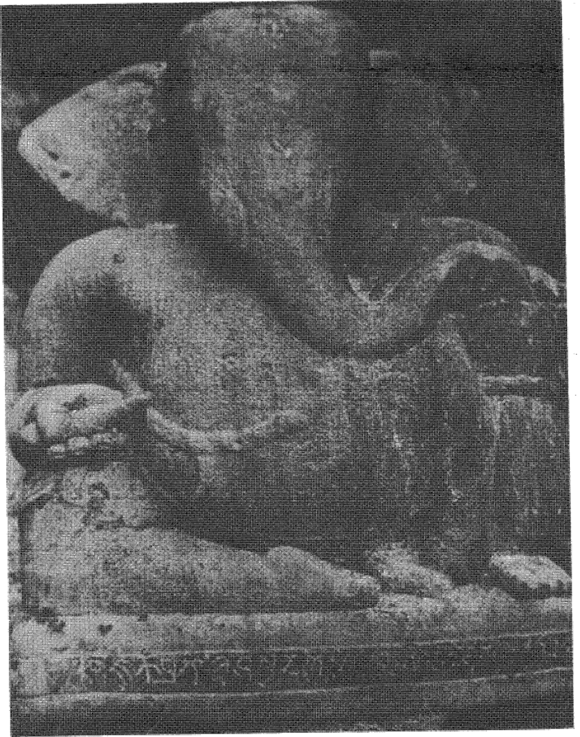
चित्र नं. १