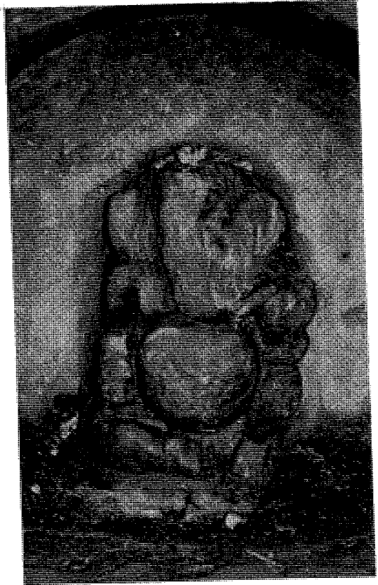
चित्र नं. ५