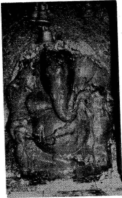
चित्र नं. ४