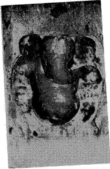
चित्र नं. ७