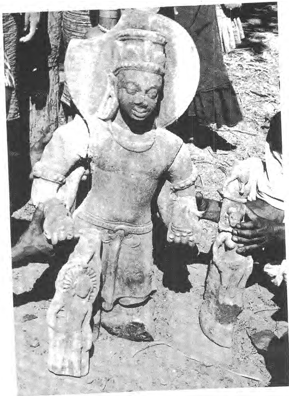
(चित्र नं. 3)