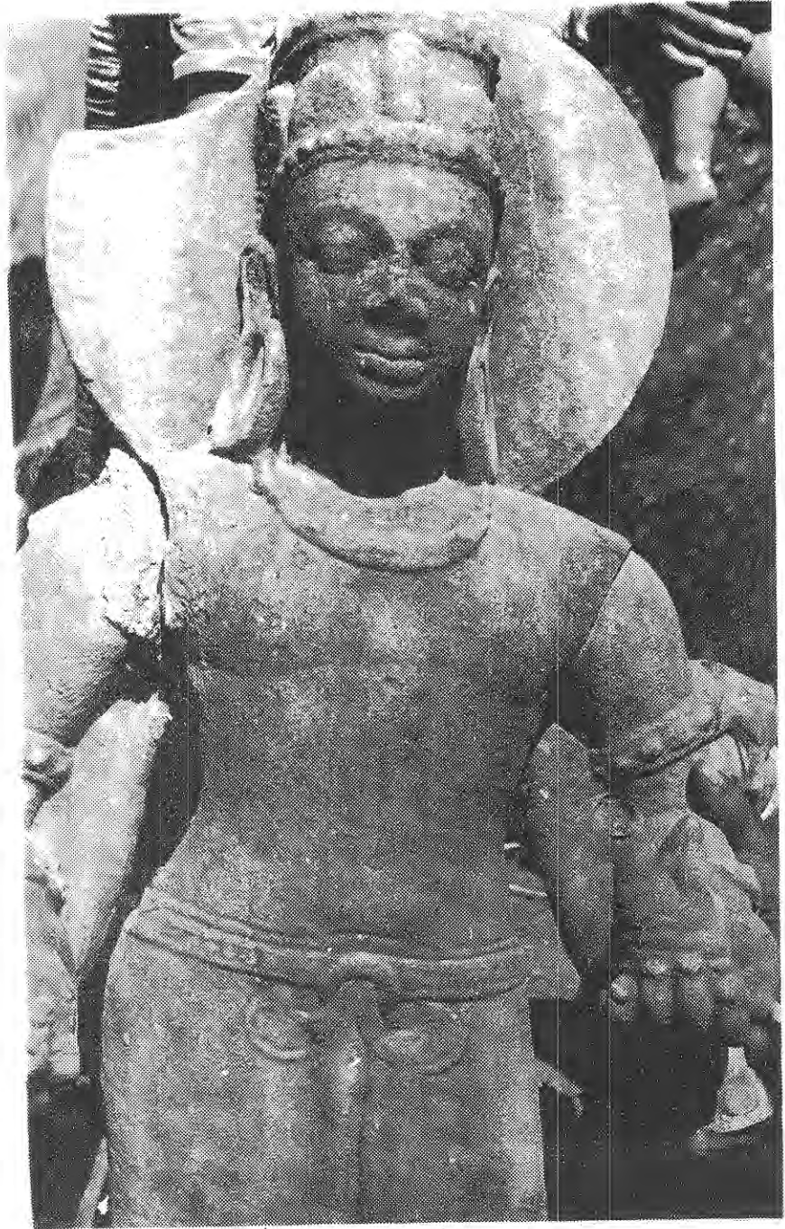
(चित्र नं. 1)