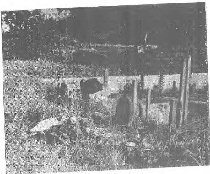
नुवाकोट माडी दरवारवारे प्रकाश पार्ने शिलालेख रहेको स्थल