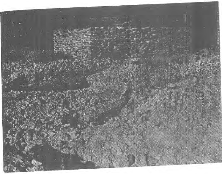
नुवाकोट-माडी दरवारको जग खन्दा निस्केका ढुङ्गाहरू