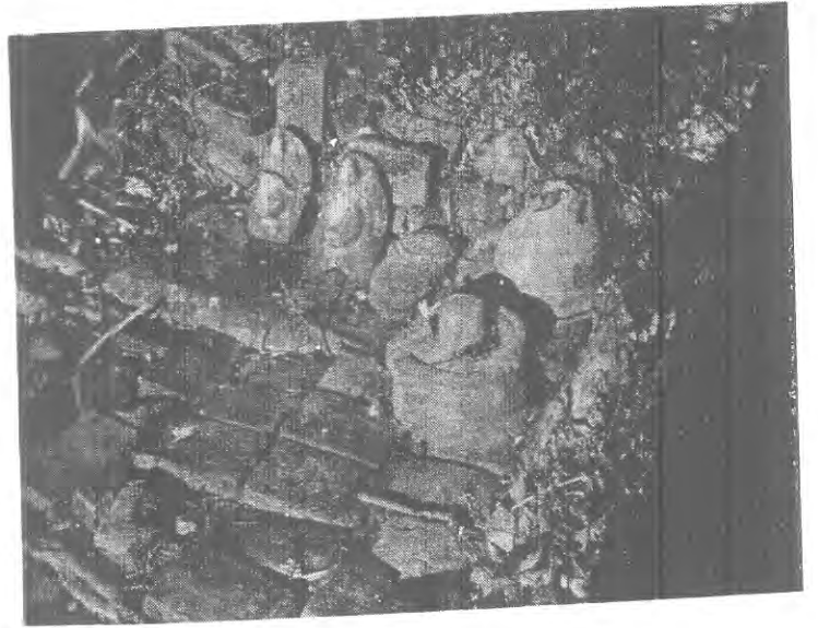
नुवाकोट-माडी दरवारको भग्नावशेषबाट प्राप्त तेलिया ईंट, देवमूर्तिहरूको नमूना