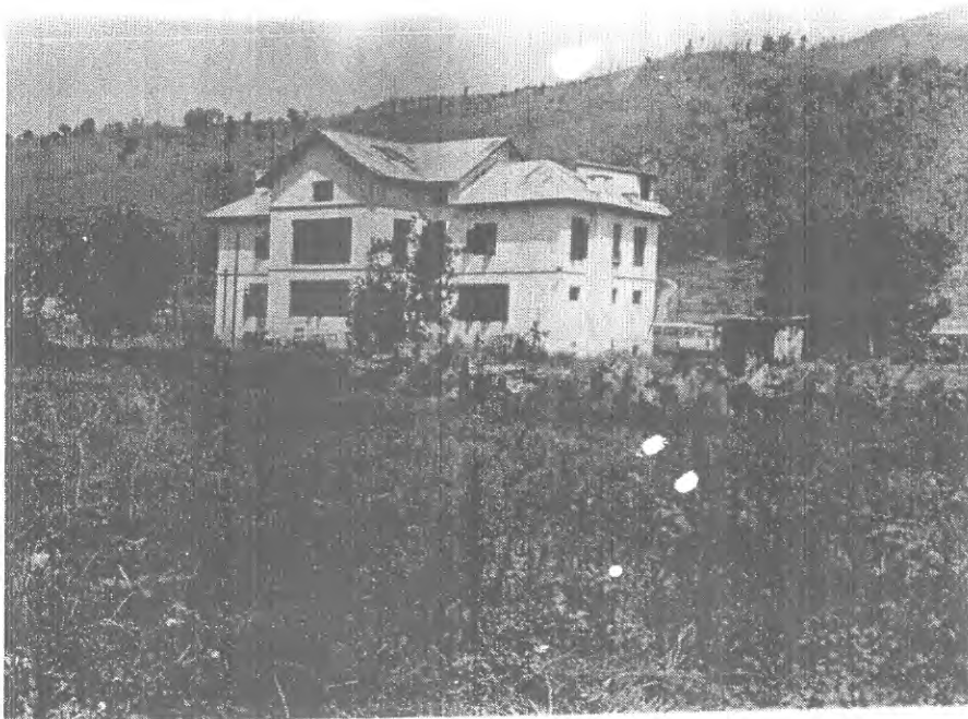
श्री ३ जुडको समयमा निर्मित शैरा दरबार (परिष्कृत रूपमा)