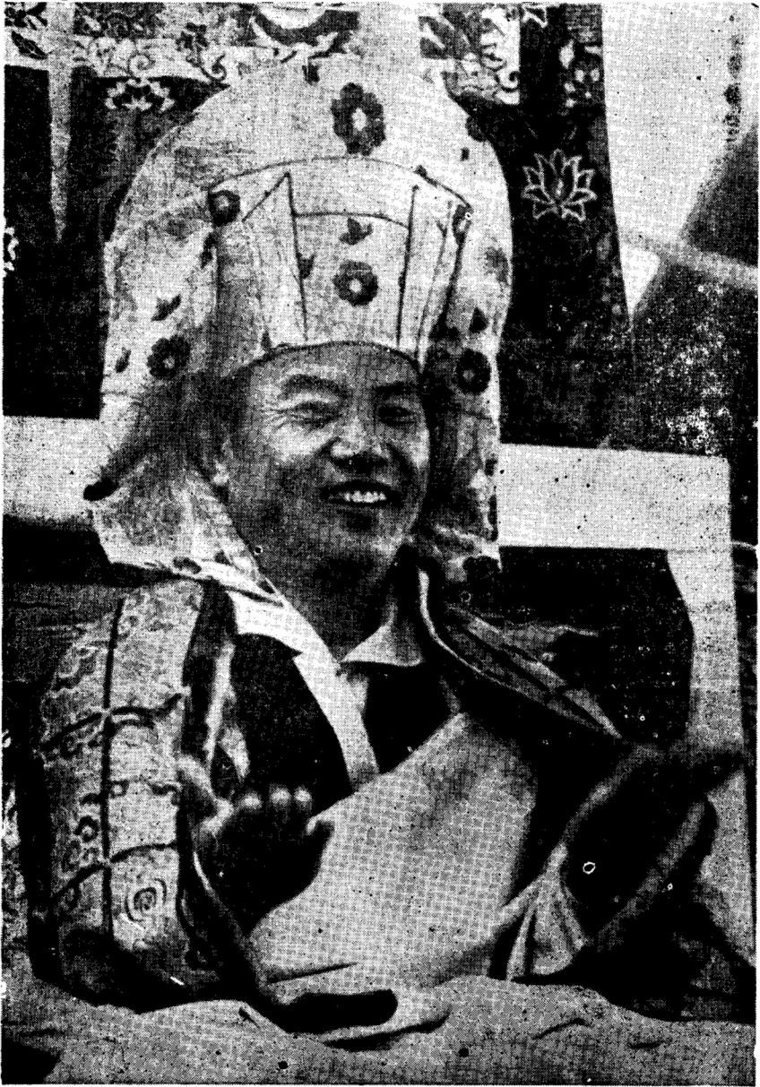
His Holiness the XVI Gyalwa Karmapa (1924 - 1981 A. D.)