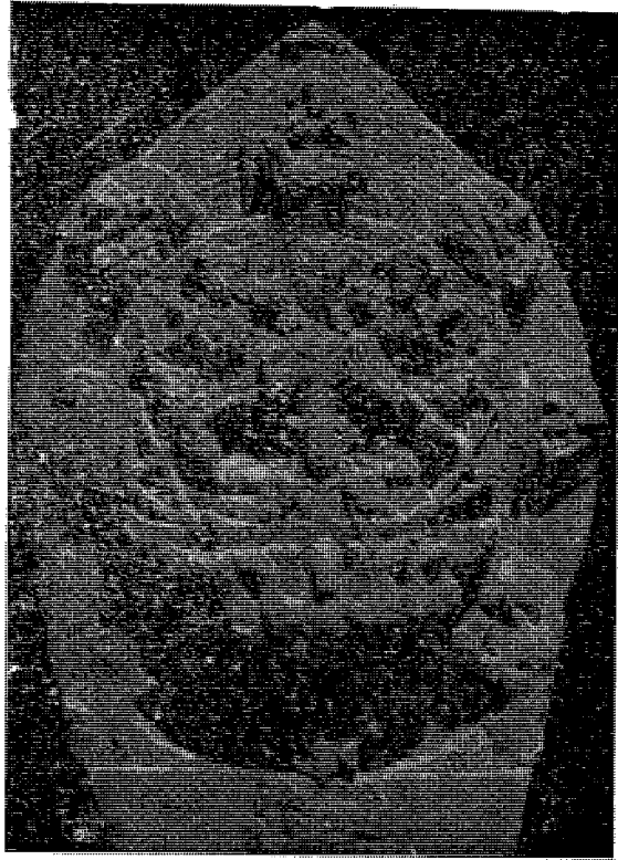
ख, ललितपुर सीगल टोलमा रहेको चन्द्रमूर्ति ।