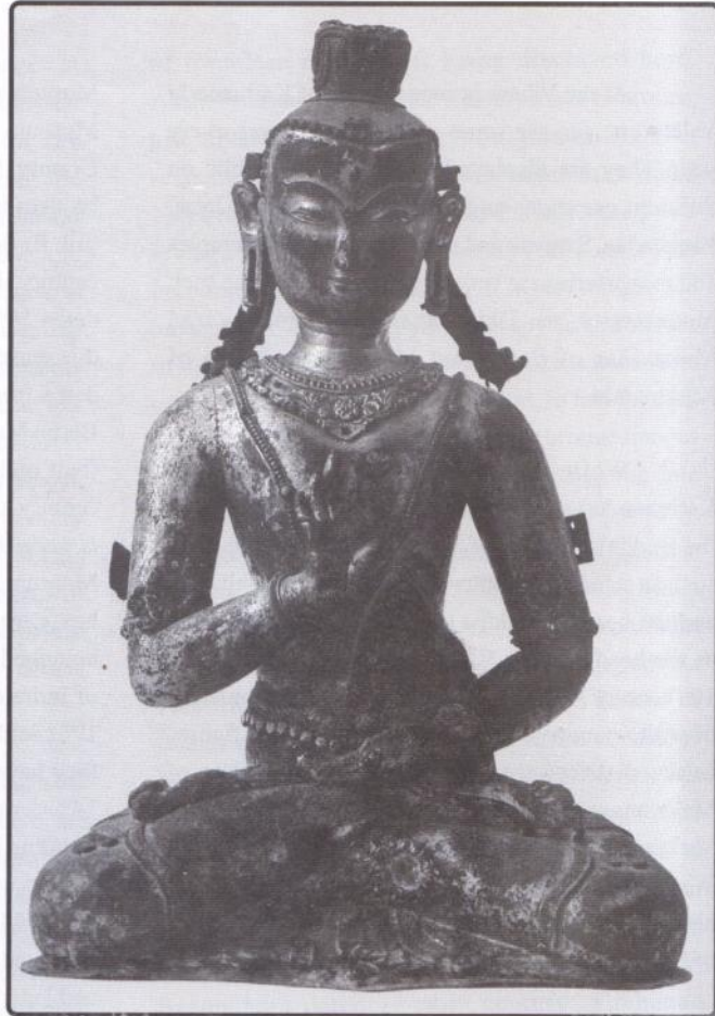
Amoghasiddhi, 14th Century bronze sculpture, H. 40 cm, National Museum, Kathmandu