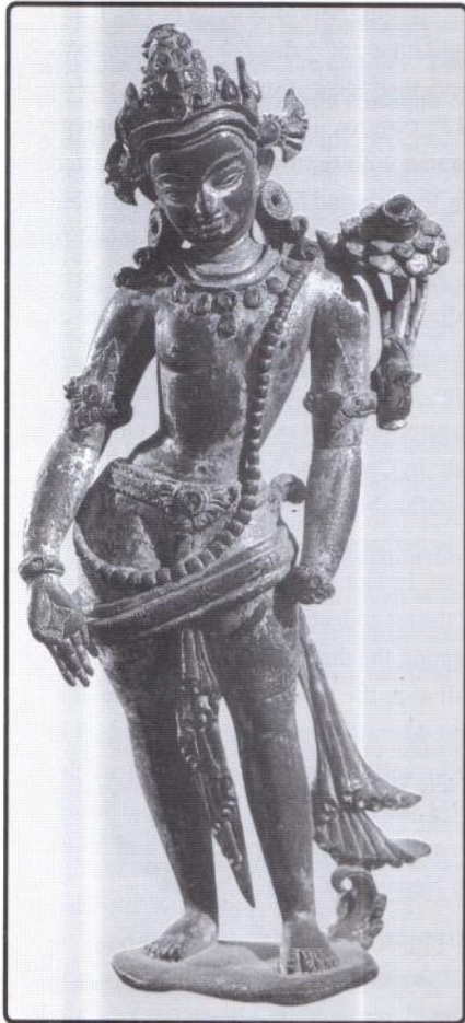
Padmapani Lokeshvara, 15th Century, bronze sculpture, H. 20 cm, National Museum, Kathmandu