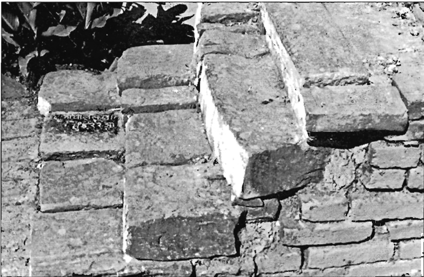
चित्र संख्या १० 'क' पहिलो खुड्किलोको रूपमा प्रयुक्त भूपतीन्द्र मल्लको पालाको पत्र, विश्वप्रसिद्ध पाँचतले मन्दिरको इतिहास बाँचिरहेको यो पहिलो शिलाभिलेख-प्रमाण यसै स्थानमा रहिरहने हो भने भोलि त्यो पुरातात्विक सम्पदालाई यस चित्रमा मात्र हेरेर चित्त बुझाउनु पर्ने हुन्छ ।