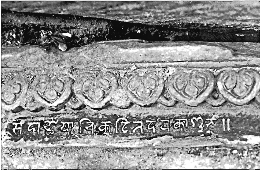
चित्र संख्या ९ कुनै सुन्दर वास्तुकृति बनाउँदा राखिएको यो अभिलेख सहितको भाग भताभुङ्ग अवस्थामा भुईमा धसिएर रहेको छ ।