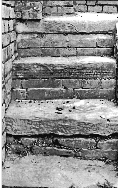
चित्र संख्या ८ 'ख' पूर्वाभिमुख सिँढीको 'तेश्रो खुड्किलो' हुनपुगेको दुङ्गेपत्र, यी दुवै पत्रहरू एउटै अभिलेखका हुन् ।