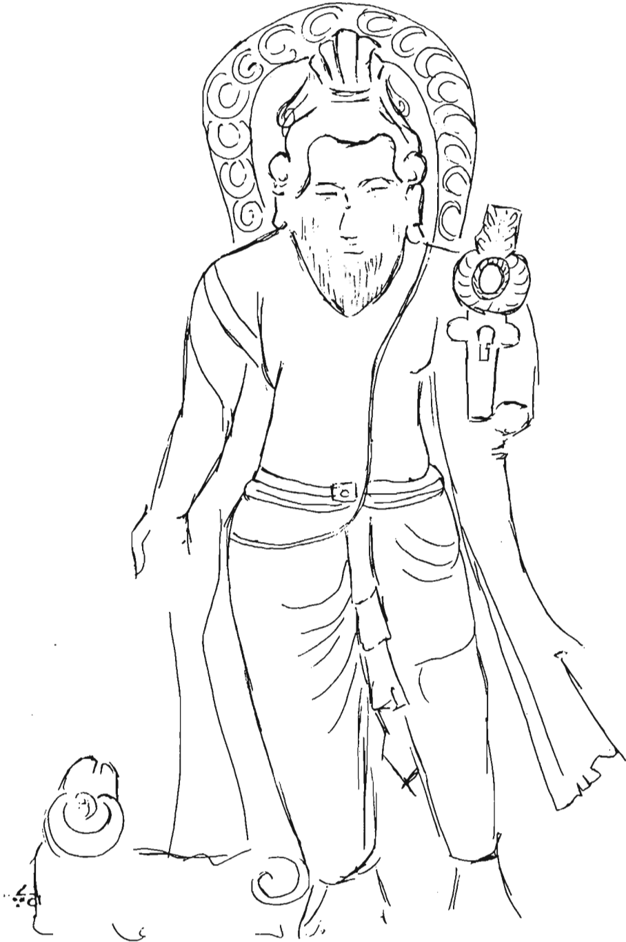
पशुपति ब्रम्हा मन्दिरको अग्निदेवको रेखाचित्र