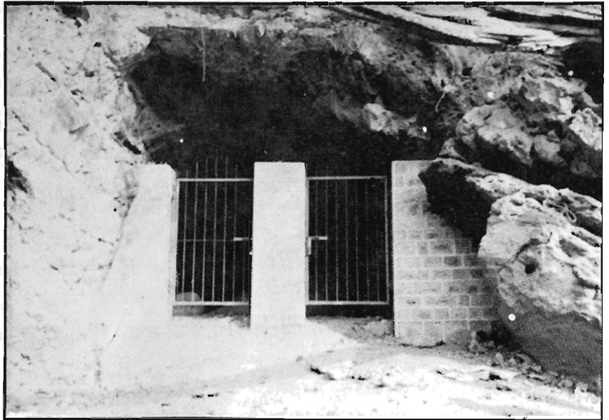
वसाहा गुफा प्रवेशद्वार

विभिन्न प्रकारका शिवलिंगहरू रहेका छन्। यहाँ शिवलिंगहरूको संख्या १०० भन्दा बढी रहेको छ। यहाँ शिवलिंगहरूको संख्या १०० भन्दा बढी रहेको छ। यहाँ शिवलिंगहरूको संख्या १०० भन्दा बढी रहेको छ।