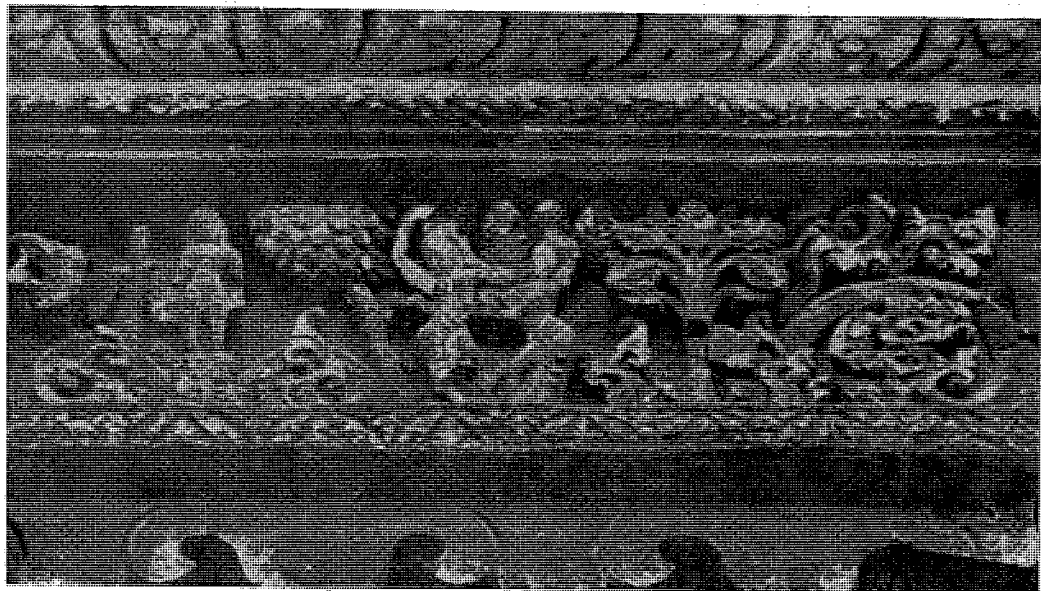
बुद्धको जन्म ।