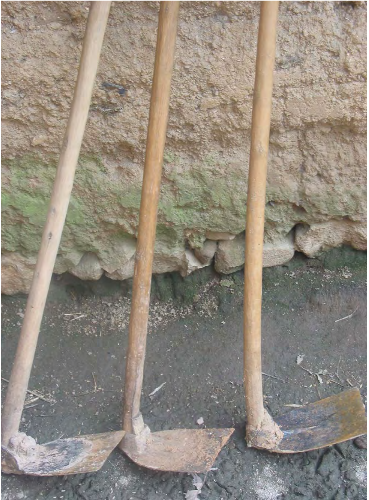
Figure 39. Villagers buy xo^{53} ts^h u^{11} 'mattock' heads in Lizhou Township Town, but make the handles themselves ( dzə^{11} qu^{11} Village).