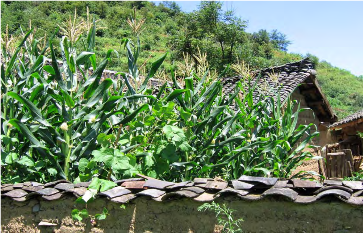
Figure 15. Corn in the courtyard of Libu Laksi's house (dzə 11 qu 11 Village).