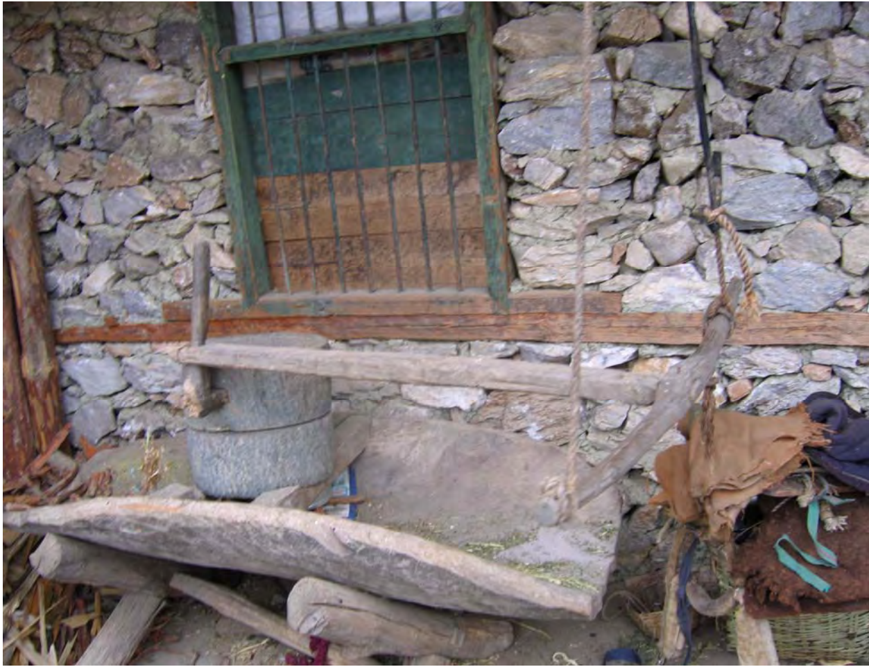
Figure 42. A ro 53 t'o 53 'millstone' under the eaves of li 44 bu 55 ʂə 11 pə 53 's home. The family stopped using it in 2002 because a village family bought a machine that people now use to grind corn and soybeans ( dzə 11 qu 11 Village).