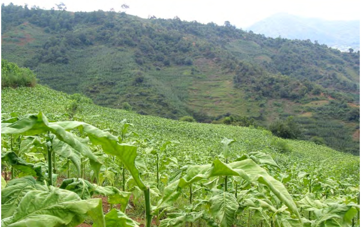
Figure 24. Tobacco field (dzə 11 qu 11 Village).