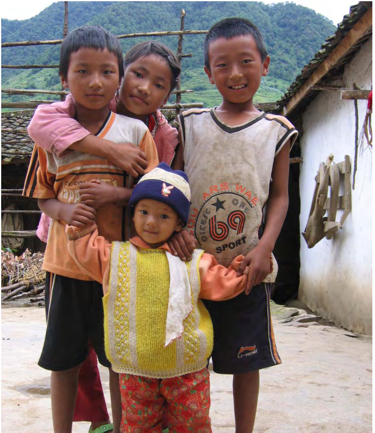
Figure 20. Namzi children (dzə 11 qu 11 Village).