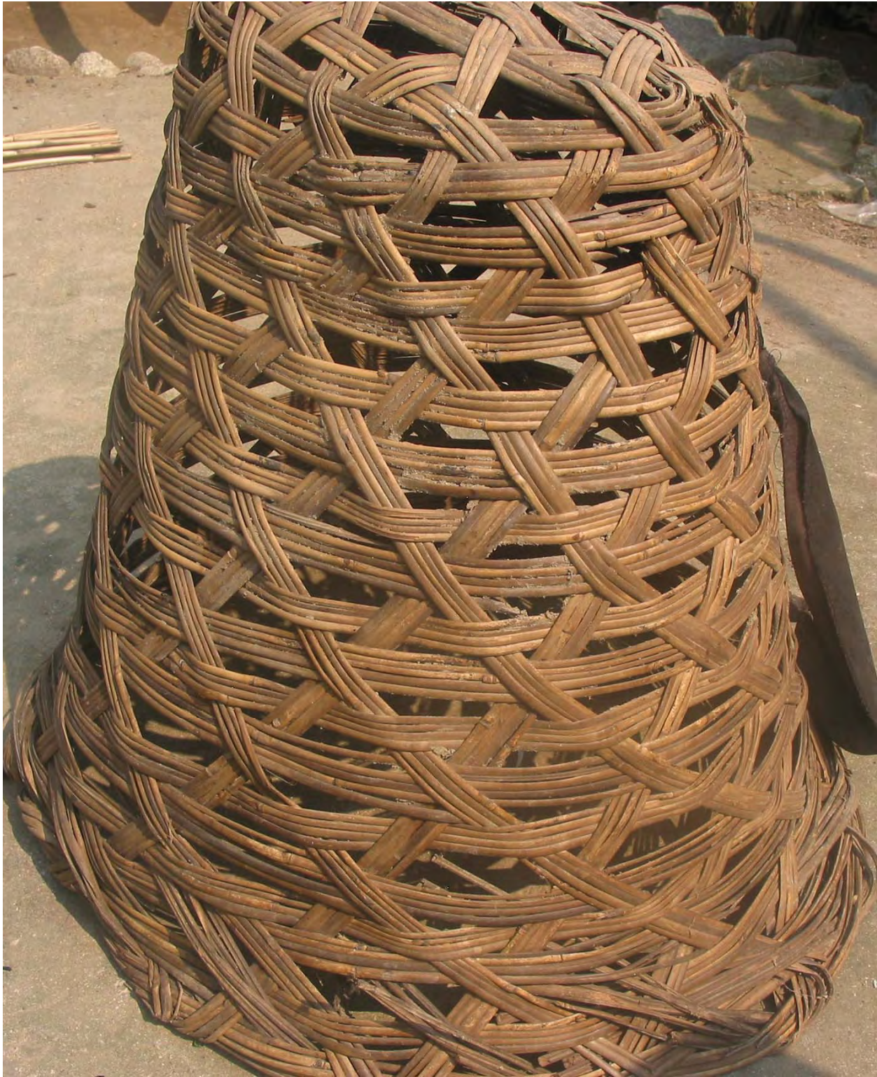
Figure 34. A k'a'' 'backbasket' made from wild bamboo. High mountains are visited in spring to cut wild bamboo the size of the little finger. The bamboo is pulled back home, cut into about four strips, and soaked in a river for about a week. Only a few dzə 11 qu 11 villagers know how to weave the baskets. Families who want new baskets invite them to their homes to do the weaving. When they finish and leave the home, they are given rice and/or corn (dzə 11 qu 11 Village).