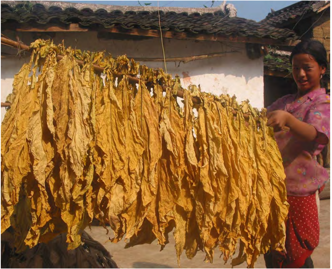
Figure 28. Libu Lakhi's niece removes dried tobacco from the tobacco drying room to a cool storage area inside the home (dzə 11 qu 11 Village).