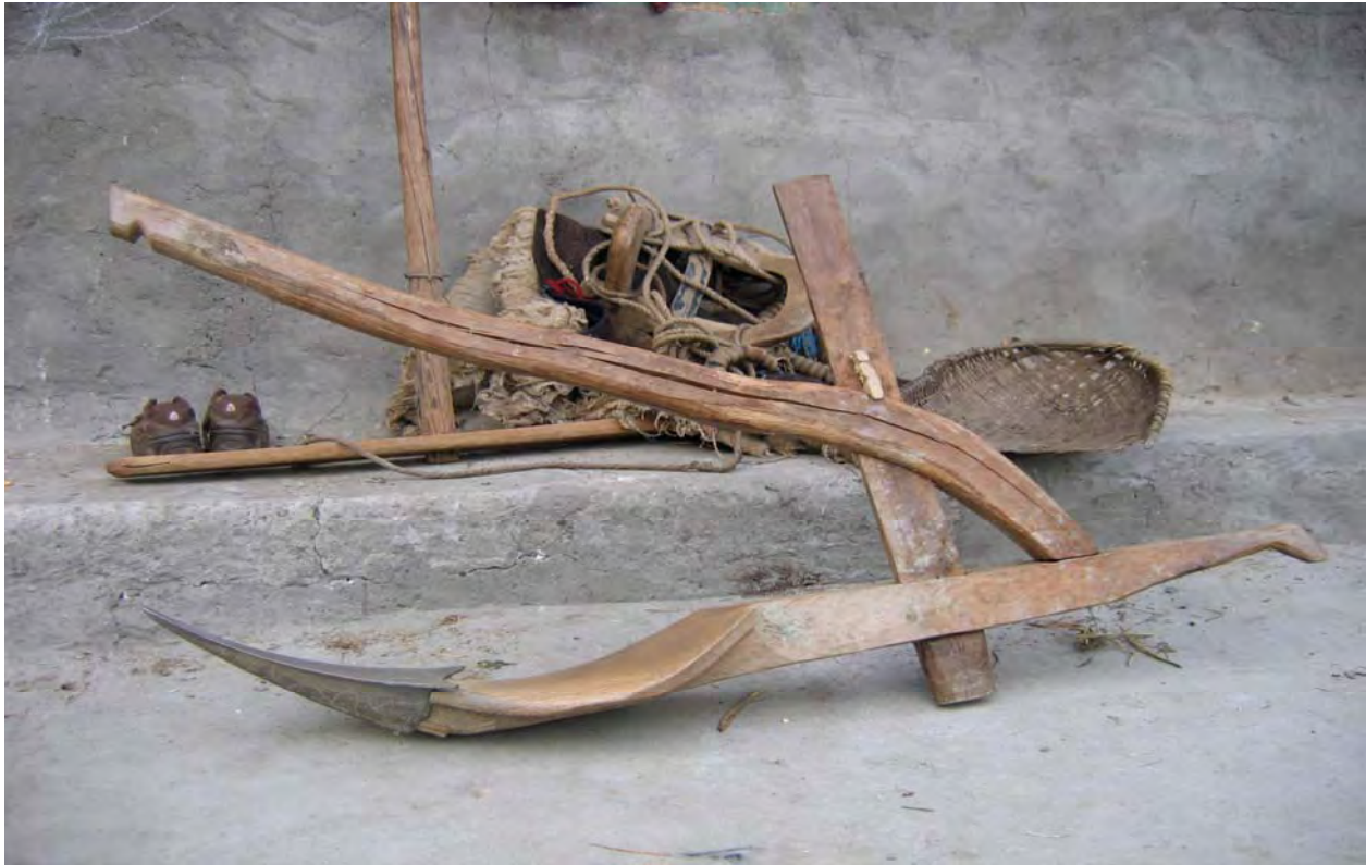
Figure 37. The dbu 53 'plow' used for plowing dry land (dzə 11 qu 11 Village).