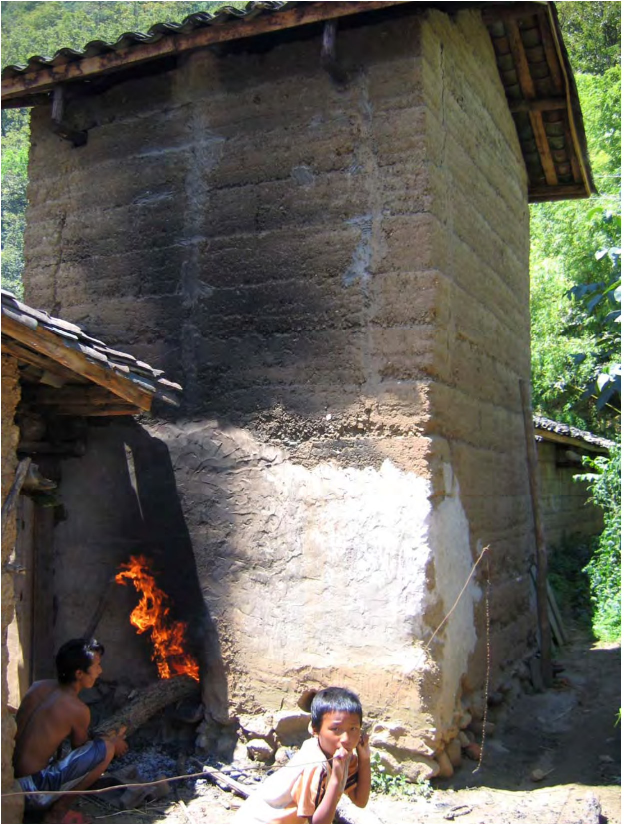
Figure 26. Tobacco drying room, Libu Lakhi's home (dzə 11 qu 11 Village).