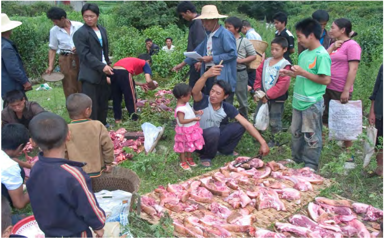
Figure 23. Nuosu and na 53 mzi 53 people divide pork and beef on the day of the Torch Festival. Villagers contribute money and buy a pig and cow, slaughter the animals and then divide the meat, which they take home and cook (dzə 11 qu 11 Village).