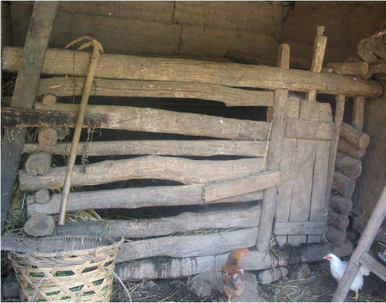
Figure 40. A pig sty (dzə 11 qu 11 Village).