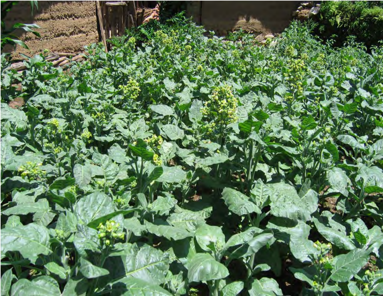
Figure 29. li 44 bu 55 ʂə 11 pə 53 plants local tobacco inside the family enclosure for his own consumption. Other tobacco is sold to the government at fixed prices at the township town. Insecticides are used on the tobacco that is sold to the government but are not put on the tobacco pictured here. li 44 bu 55 ʂə 11 pə 53 also believes the tobacco he grows for self-consumption is tastier and stronger tasting than the tobacco grown for sale (dzə 11 qu 11 Village).