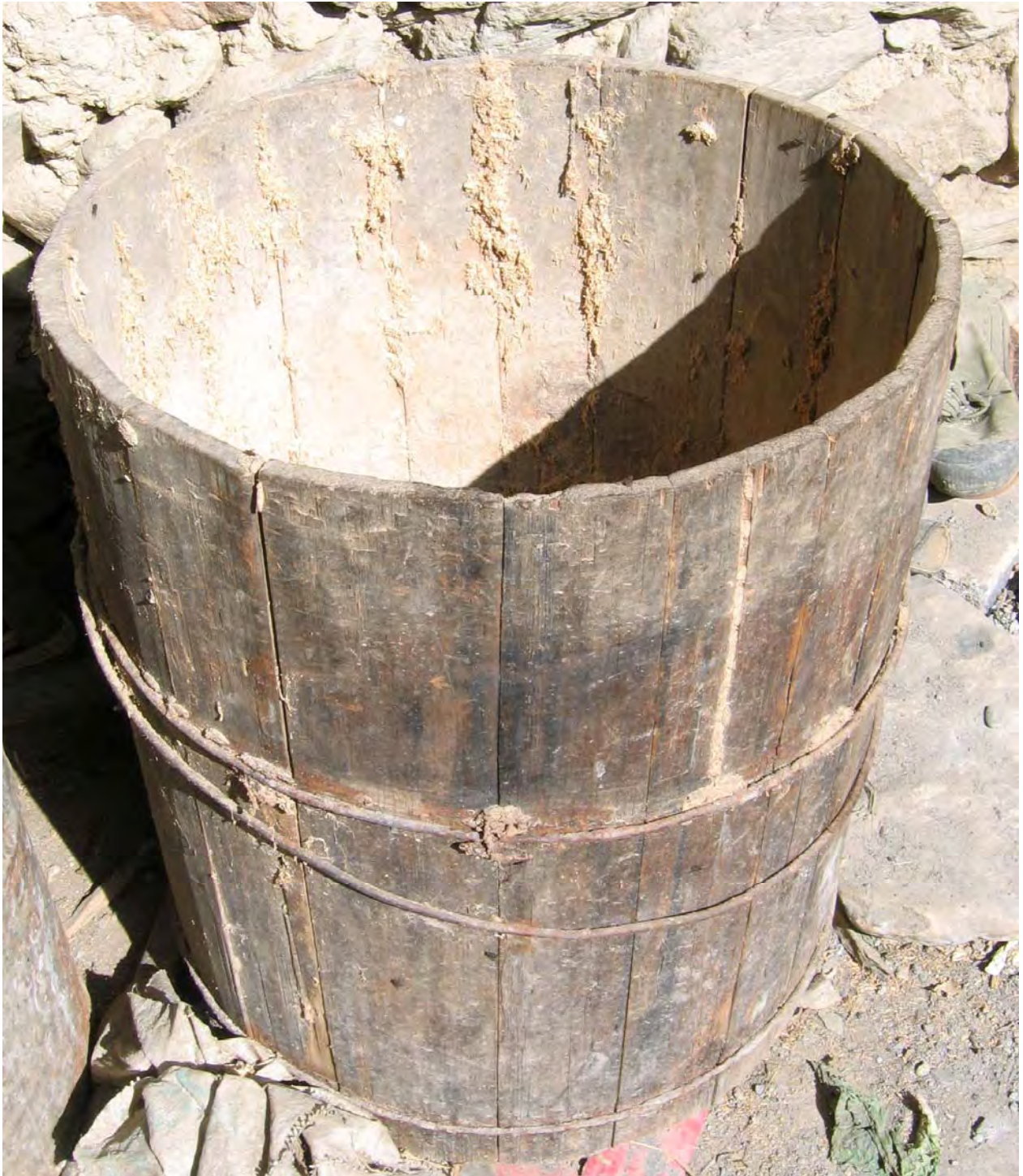
Figure 41. A xwa 11 tʰo 53 'wood container' for storing dry rice husks and corn meal for pig food (dzə 11 qu 11 Village).