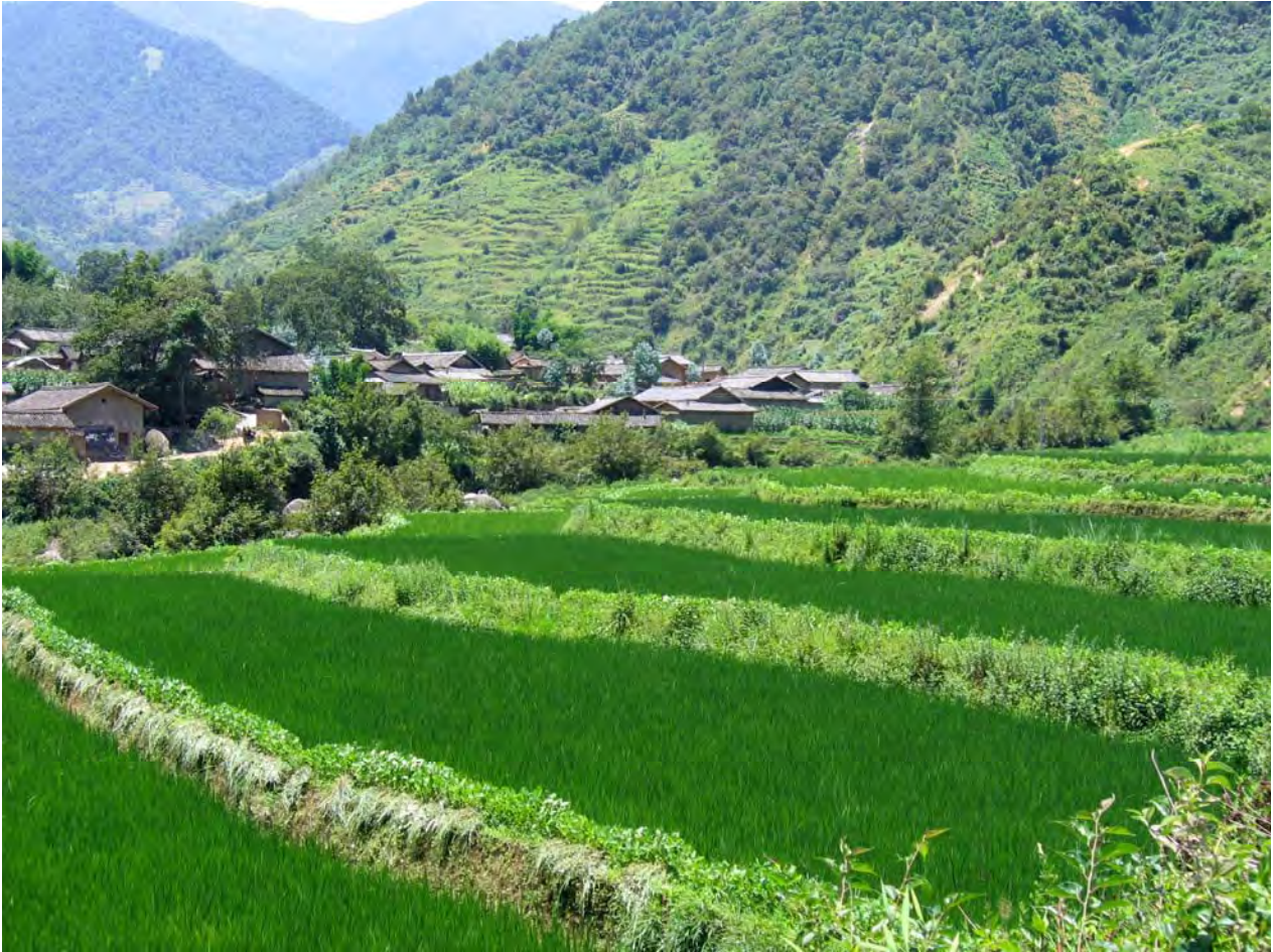
Figure 12. dzə 11 qu 11 Village, looking west. Rice (foreground) is the main village crop. A