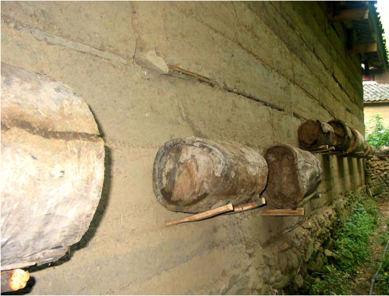
Figure 19. li 44 bu 55 ʂə 11 pə 53 raises bees in hives under the eaves. Honey is collected in spring when there are many blossoming plants. In winter, people believe trees with poison flowers bloom and they do not collect honey then (dzə 11 qu 11 Village).