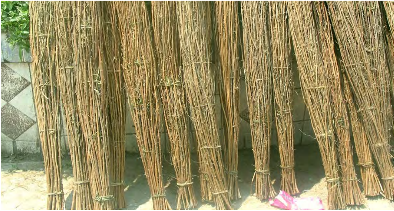
Figure 21. Torches for tzi 44 'the Torch Festival'. In late summer when the wild \gamma^{11} na 53 plant is dry and its leaves are gone, it is collected and children ready them as above for the Torch Festival (dzə 11 qu 11 Village.)