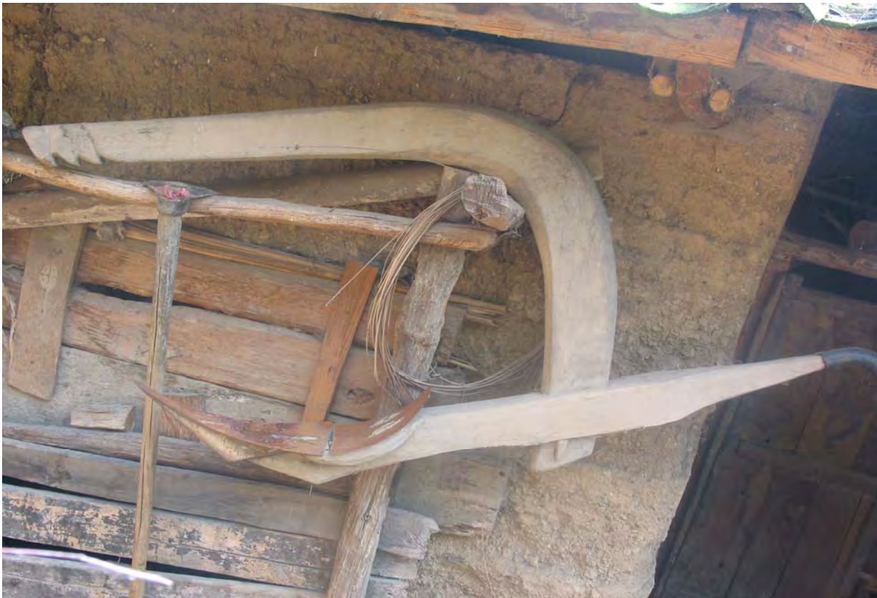
Figure 38. The dbu 53 'plow' used to plow rice fields (dzə 11 qu 11 Village).