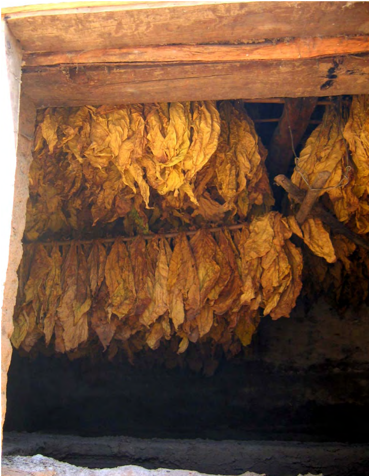
Figure 27. Dried tobacco in the tobacco drying room, Libu Lakhi's home (dzə 11 qu 11 Village).