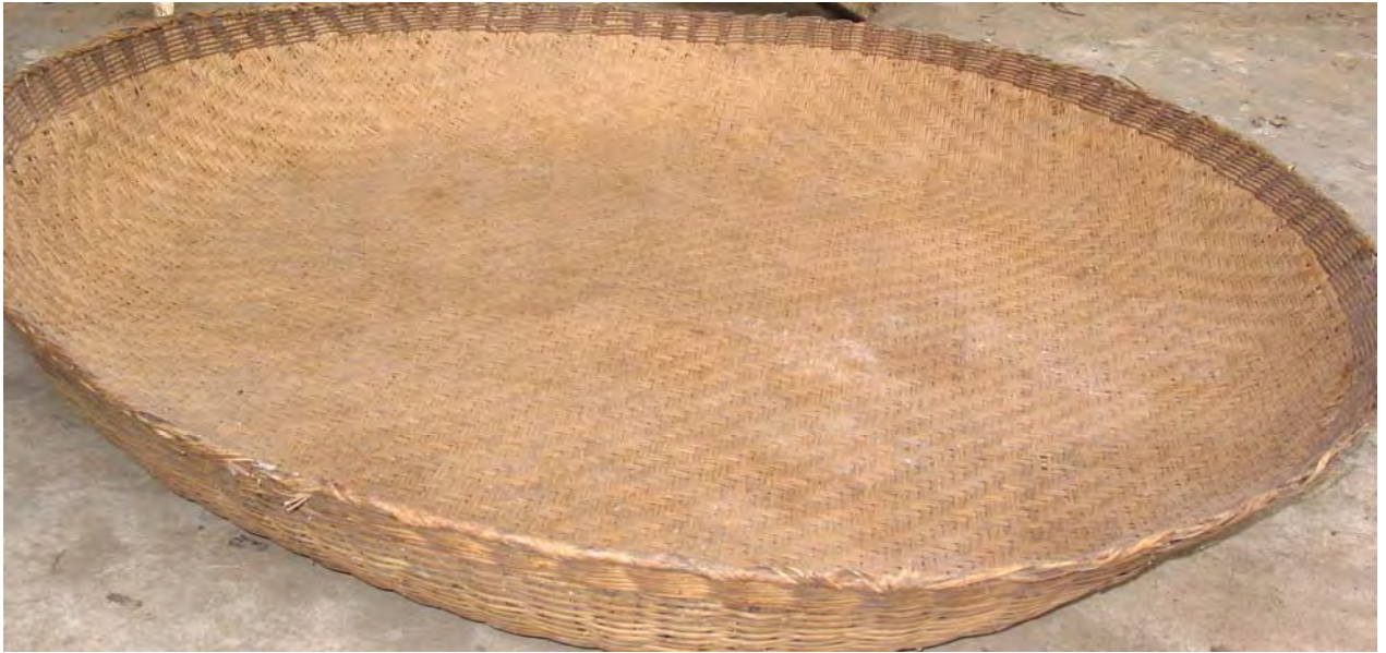
Figure 35. A mo 44 tshə 53 'grain-drying tray', is made from home-grown bamboo. Wild bamboo is easily broken when bent whereas home-grown bamboo is more pliant, and used to make mo 44 tshə 53 (dzə 11 qu 11 Village).