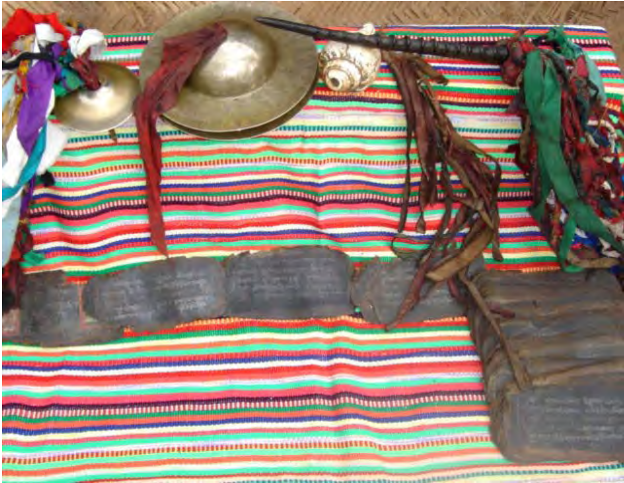
Figure 31. Ritual implements and old Tibetan scriptures owned by a family i(dzə 11 qu 11 Village).