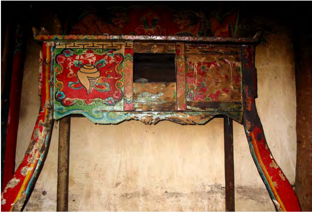
Figure 17. Libu Laksi's home ga 53 ha 53 'sacrifice place'. The ga 53 ha 53 is usually left of the hearth ( dzə 11 qu 11 Village).