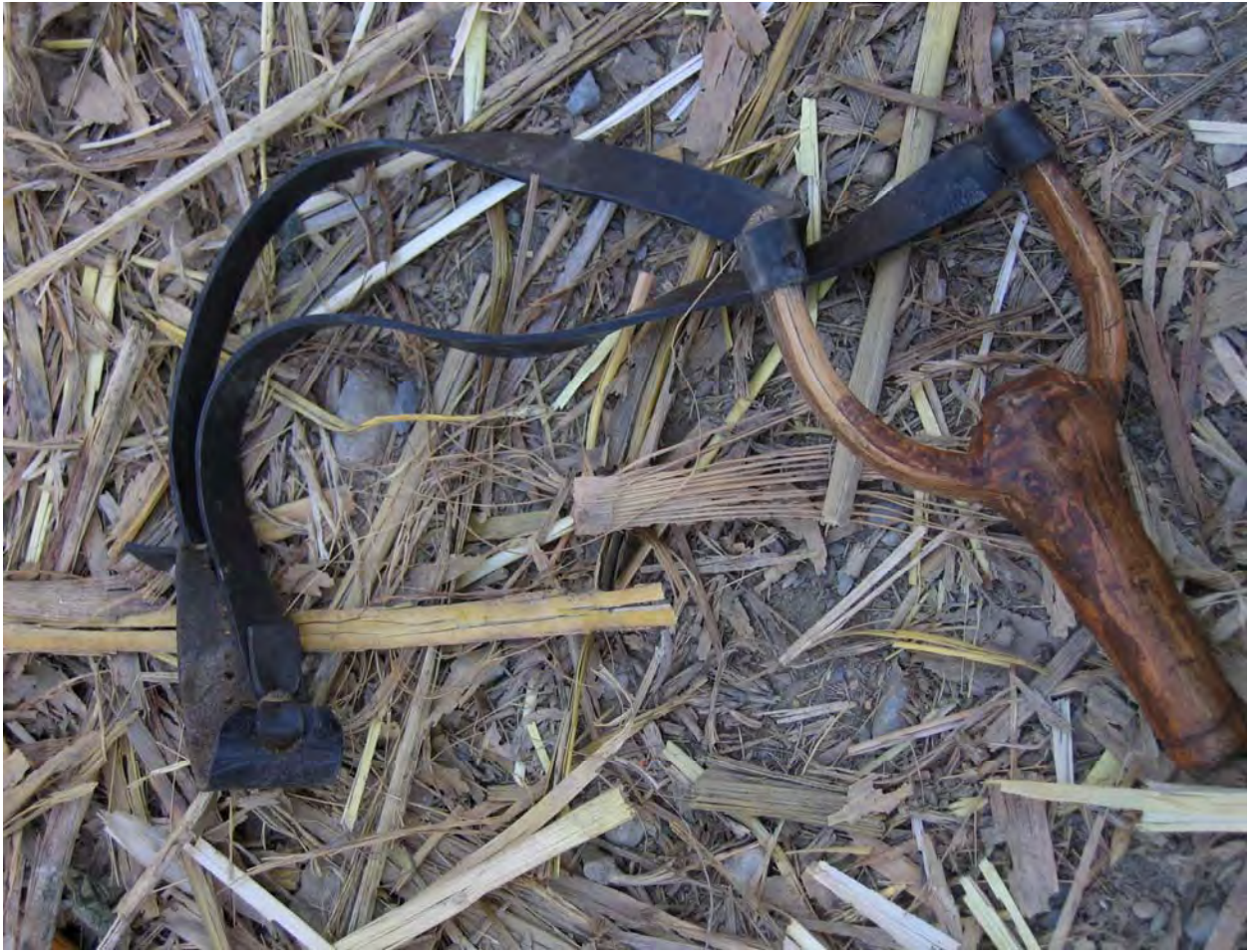
Figure 43. A ta'11 ko'53 'catapult' children use to kill birds (dzə 11 qu 11 Village).