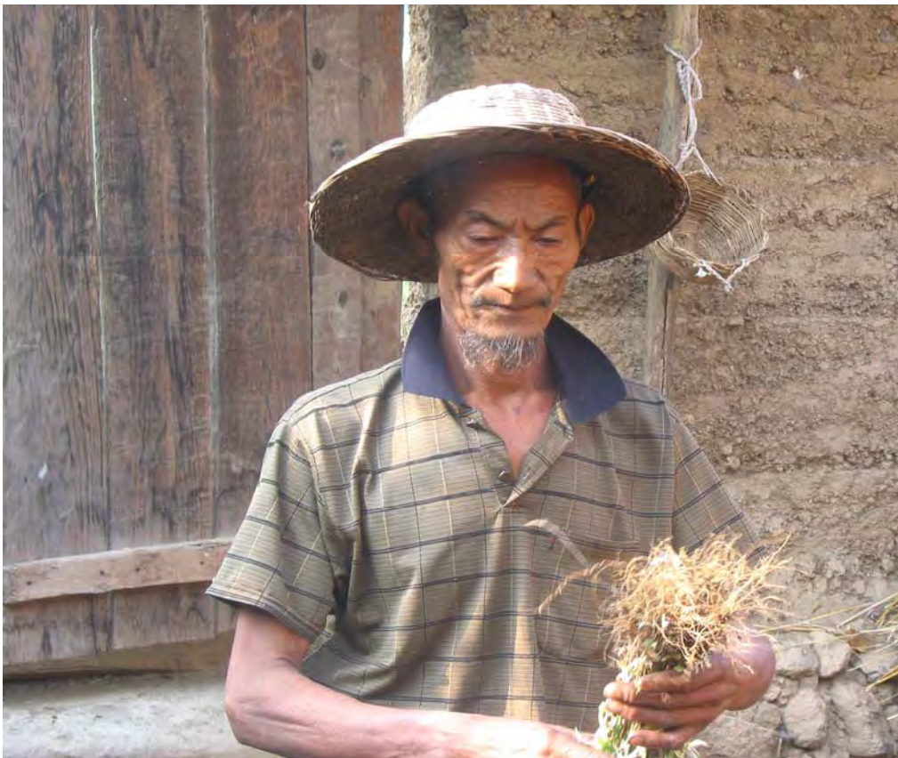
Figure 18. li 44 bu 55 sə 11 pə 53 prepares və 53 , a wild herb, which is dried and then smoldered to drive bees away from the hive when honey is collected ( dzə 11 qu 11 Village).