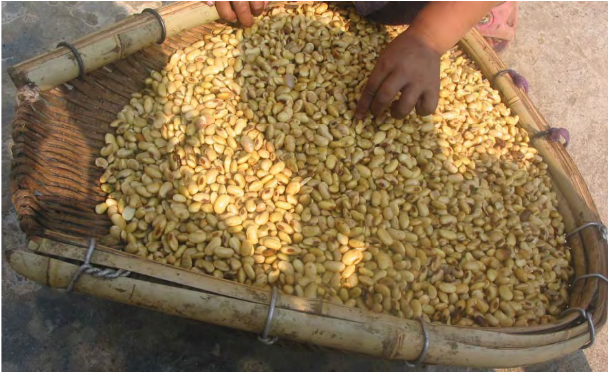
Figure 33. Soybeans are soaked in water prior to making tofu (dzə 11 qu 11 Village).