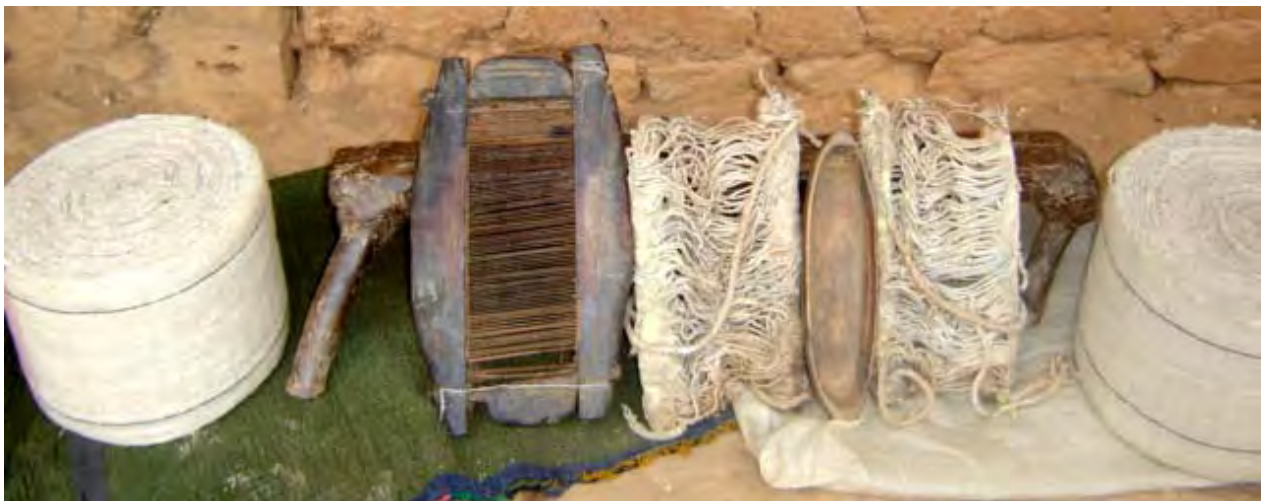
Figure 32. Home-spun fabric made from hemp and fabric-making tools (dzə 11 qu 11 Village).