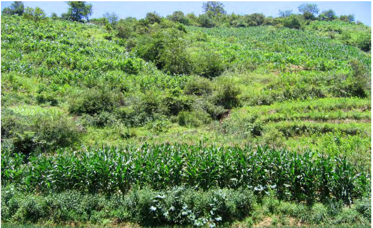
Figure 14. Corn on slopes (dzə 11 qu 11 Village).