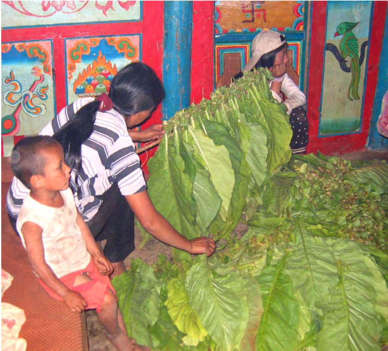
Figure 25. Tobacco leaves are fastened to bamboo sticks before drying (dzə 11 qu 11 Village).