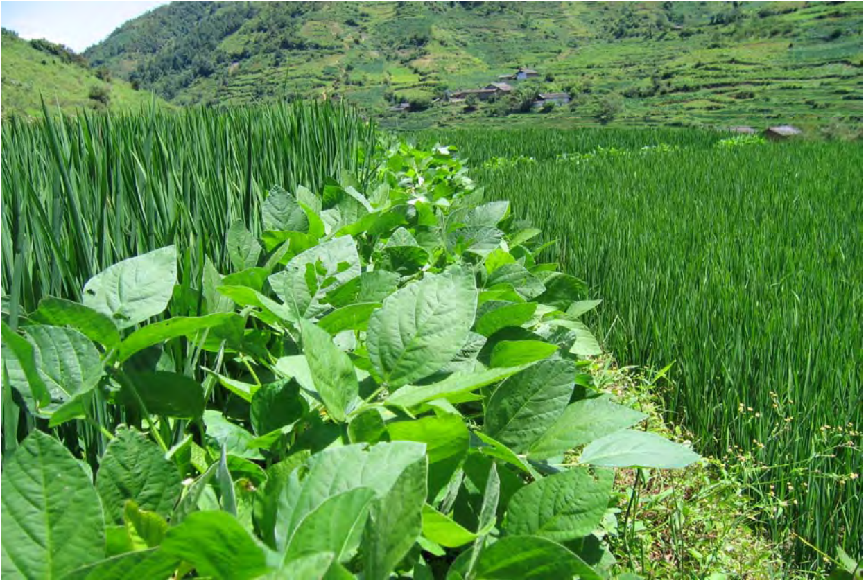
Figure 13. Green beans planted between rice fields (dzə 11 qu 11 Village).