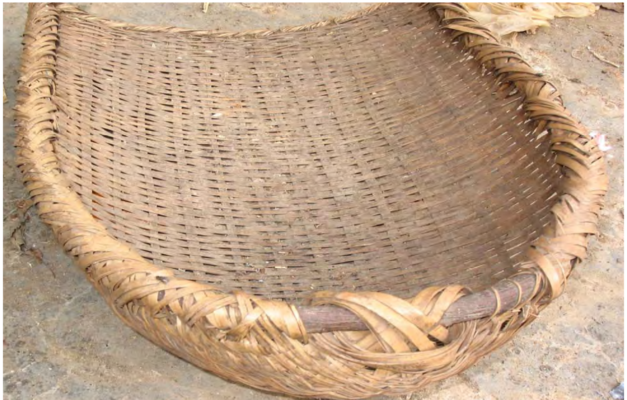
Figure 36. A ba 53 kr 53 'bamboo container' used to transport grain to a storage place (dzə 11 qu 11 Village).