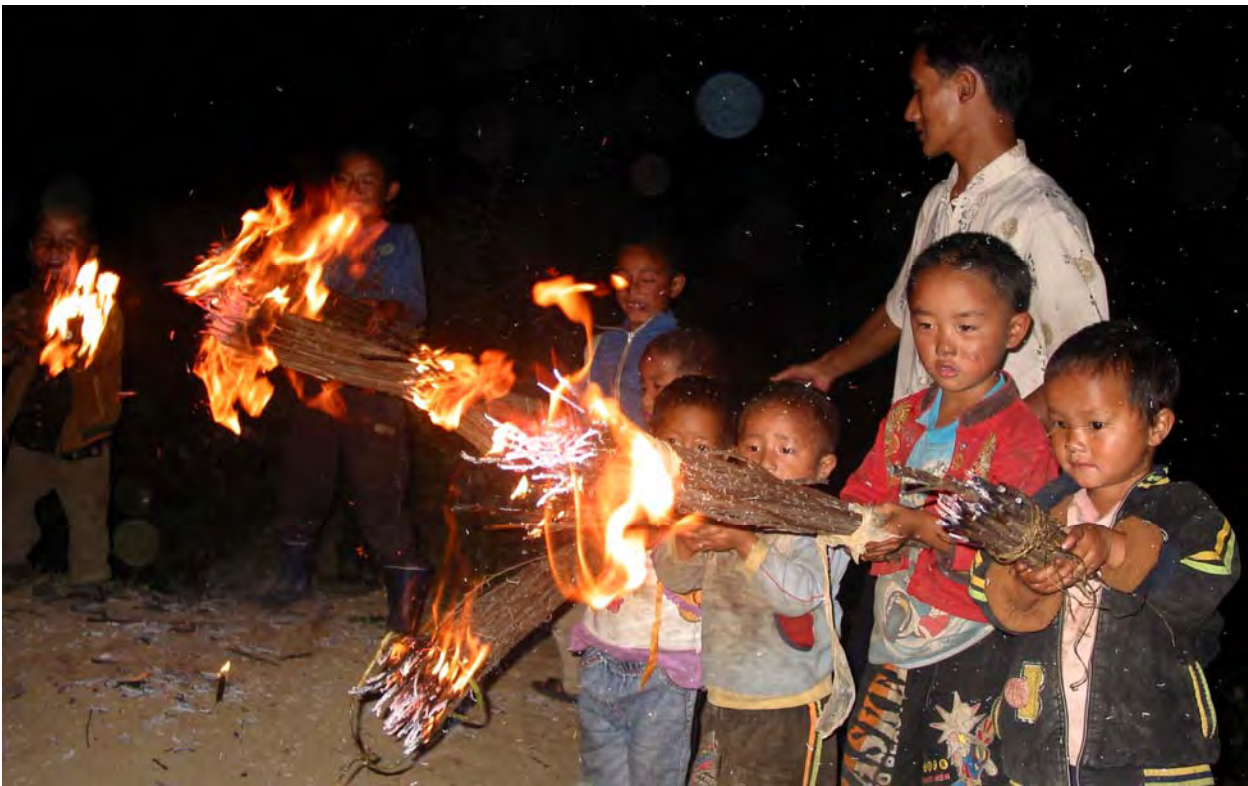
Figure 22. Children with torches at night at the Torch Festival. The festival is celebrated by both Nuosu and na 53 mzi 53 people held during the late sixth lunar month (dzə 11 qu 11 Village).