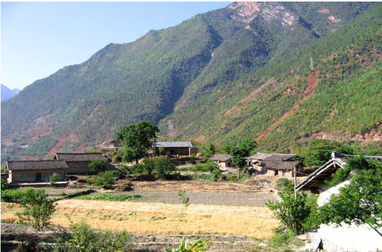
Figure 16. Summer wheat field (Mu'er Village, Mianning County).